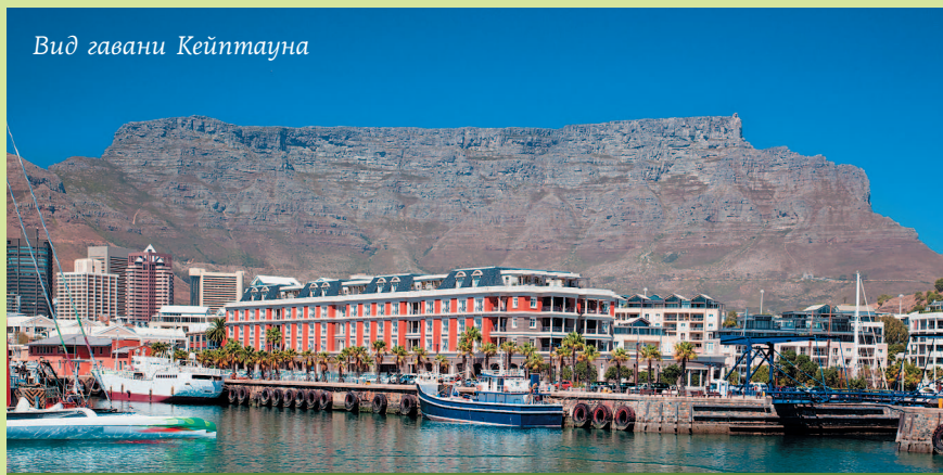
Вид гавани Кейптауна

Каждый год с октября по март город заполняют туристы, приезжающие понежиться под теплым летним солнцем южного полушария. Помимо непереносимого подъема на фуникулере на Столовую гору (высота 1087 м), гостям можно порекомендовать совершить экскурсию в прибрежный район Виктория и Альберт. Здесь находятся недавно отреставрированные гавань и причалы, а также два исторических дока в заливе Тейбл-Бей, а на прилегающих улочках расположились всевозможные сувенирные лавки, музеи, отели и рестораны. Неподалеку находится гавань для яхт, «Аквариум двух океанов» и театр под открытым небом.