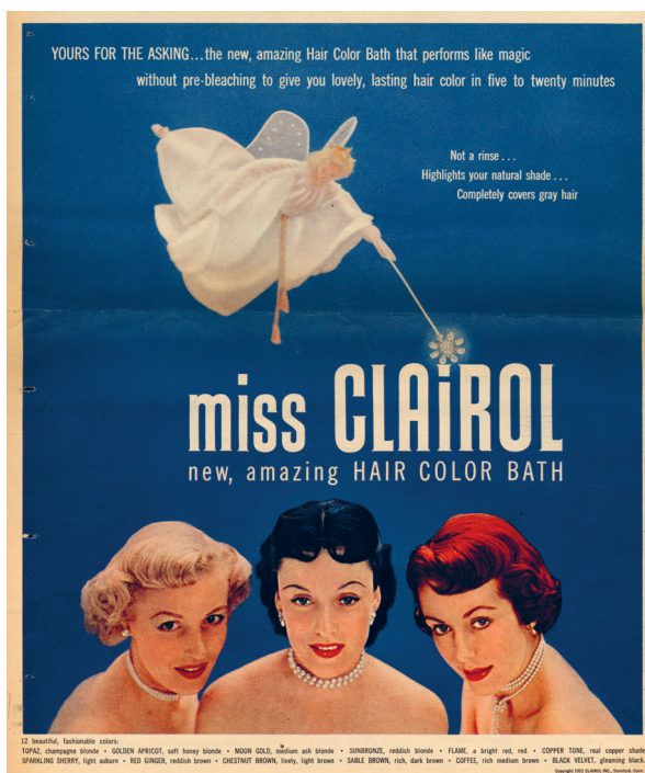
Рекламный постер Color Bath