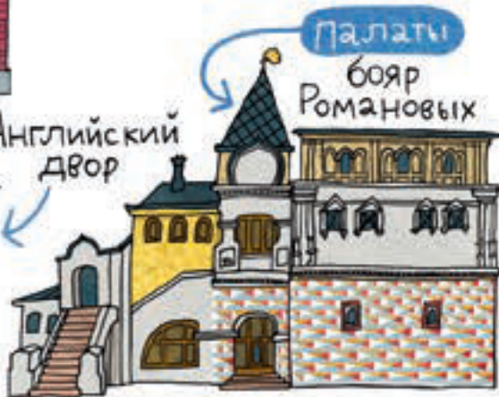
палаты бояр Романовых