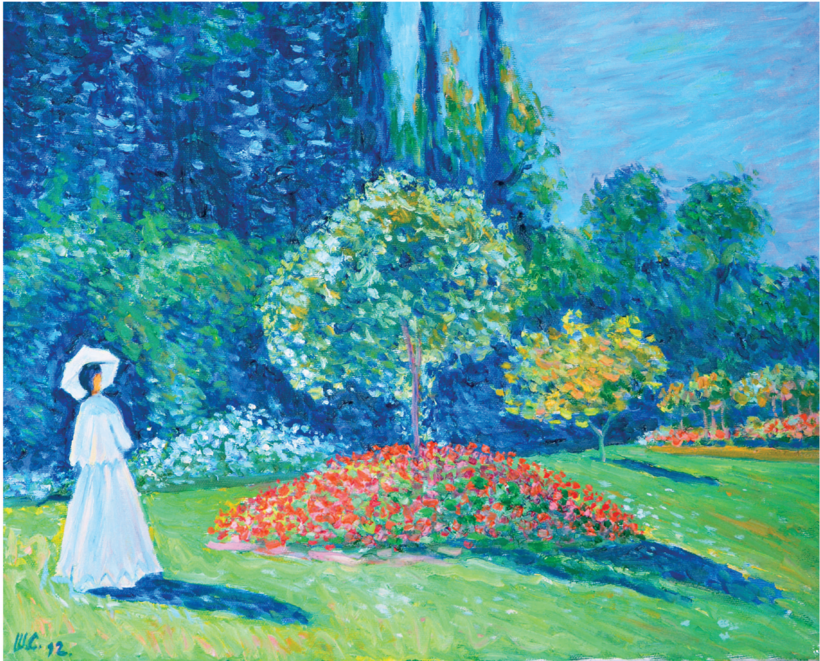
Дама в саду Сент-Адресс, 1867