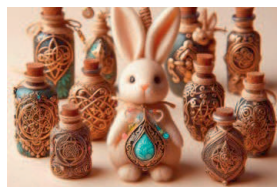
Рис. 3. Любой предмет может быть вашим амулетом, пока вы верите в его силу и в то, что он приносит удачу. Создано с помощью ИИ

Нет, его просто не используют. Так и с магическими предметами. Пока он просто лежит, это просто камешек. Оберегом его делает соприкосновение с человеком, вложенное намерение, идея и вера. Ритуал, с помощью которого «оживляют» оберег. Не зря существуют такие термины, как «зарядить» и «активировать» оберег или амулет. И каждому знакомо чувство «Вот это — мое!», это чувство и помогает амулету стать амулетом.