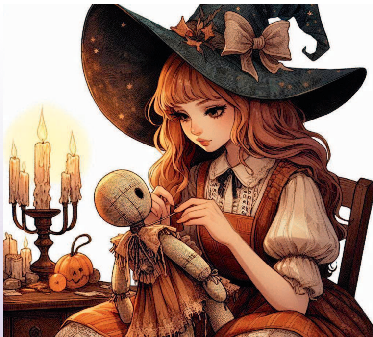
Рис. 5. Считается, что в безликую куклу не сможет вселиться злой дух, а та, у которой есть лицо, может ожить.

Главное правило таких оберегов — чтобы у фигурки не было лица: считается, что в безликую куклу не сможет вселиться злой дух, чтобы навредить обладателю амулета. Этим обережная белая магия отличается от колдовской черной, где у изготовленных человеческих фигурок обязательно рисовали или вышивали глаза и рот (рис. 5).