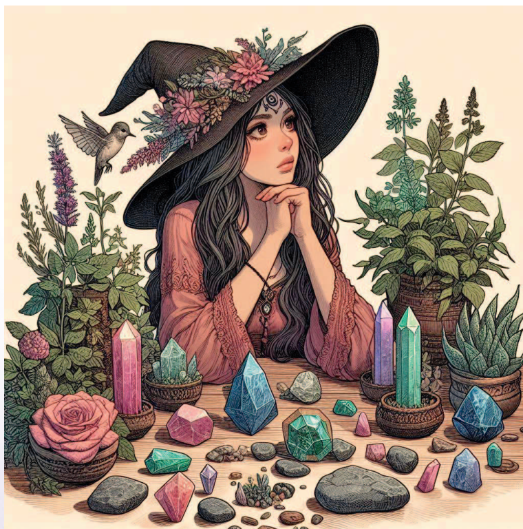
Рис. 1. Как овладеть силами природы и управлять своей судьбой? Создано с помощью ИИ

С древних времен человек желал обрести власть над своей судьбой, изменить то, что не было идеальным, защититься от негатива и приумножить удачу, получить силу животных и заглянуть в другой мир. Чтобы найти ответы на свои вопросы, люди обращались к шаманам и знахарям, колдунам и алхимикам, изучали особые свойства камней и растений и даже смотрели на звезды.