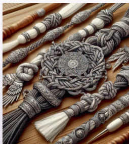
Рис. 4. Существует множество узлов.

Магия здесь начинается с самой нити, она представляет собой нечто неразрывное и продолжительное, а зачастую и вовсе приравнивается к линии жизни и самой