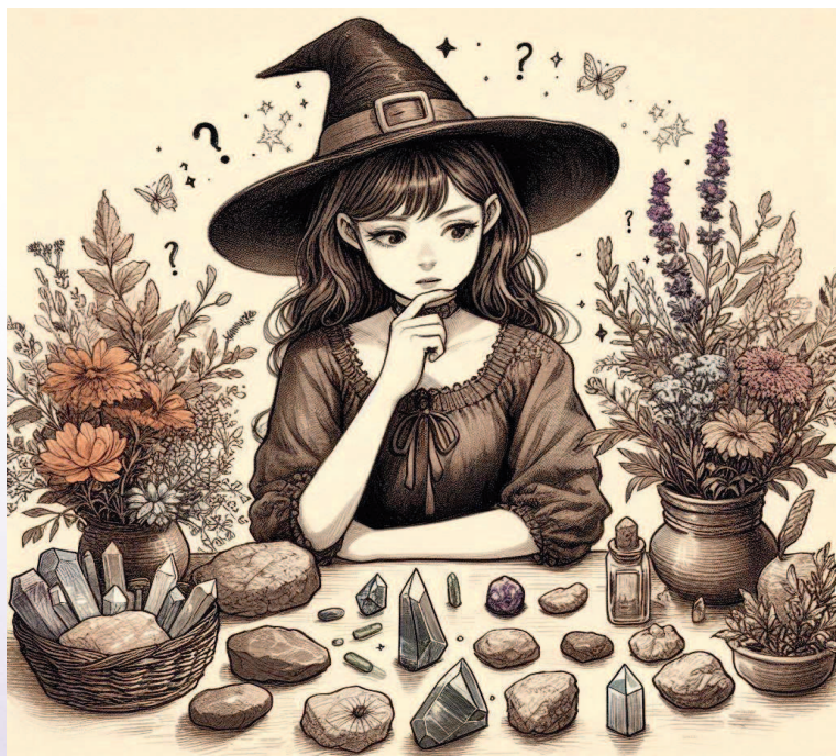
Рис. 2. Амулет? Оберег? Талисман? Как все это работает?