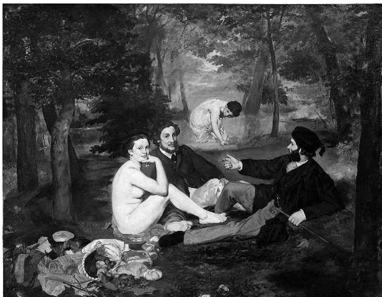
Эдуард Мане. Завтрак на траве. 1863. Музей Орсе, Париж

С картиной Джорджоне и перекликается картина Мане «Завтрак на траве». Здесь совершенно удивительный новый жанр: природа, летняя истома, деревья, тишина, ничего нет в лесу, только пикник, квартет — двое одетых мужчин и две обнаженные женщины. И эта картина, как и «Олимпия»,