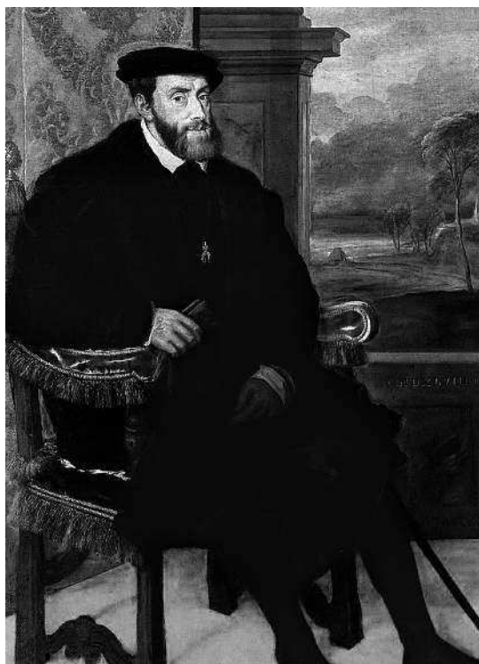
Тициан. Портрет Карла V в кресле. 1548. Старая пинакотека, Мюнхен

Венецианцы обожали женскую красоту, но в их живописи отсутствует какая-то женская активность в жизни. Женщины там присутствуют больше для любования. А «Сельский концерт» можно назвать пасторалью, причем не просто пасторалью, а пасторалью идеальной: в ней есть гармония всего со всем, гармония мира с человеком, растворенным в этой природе. Посмотрите на эти линии рук, на прозрачный кувшин... И картина называется «Концерт» не из-за того, что эти люди исполняют музыку, а потому что в ней есть то, что есть в концерте: созвучие всех инструментов и предметов. Картина имеет свой собственный голос, и все вместе созда-