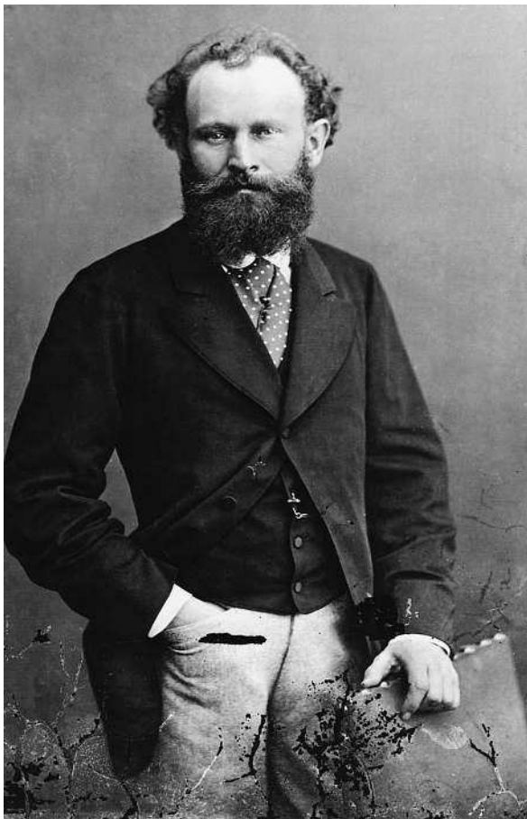
Эдуард Мане, портрет

взгляде на нее можно было бы решить, что ее написал кто-то из импрессионистов.