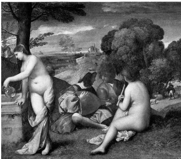
Джорджоне. Сельский концерт. 1508–1509. Лувр, Париж

На картине Джорджоне «Сельский концерт» мы видим обнаженные женские фигуры и одетые мужские. Это такой своеобразный пикник. Группа людей сидит на холме и музицирует — у них в руках музыкальные инструменты. Посмотрите, как написаны женщины — словно плоды. Надо сказать, что флорентийские художники писали женщин длинными, худыми, истеричными и напряженными, хотя флорентийки всегда были толстушками. А на картине Джорджоне женщины похожи на позднеантичных венер.