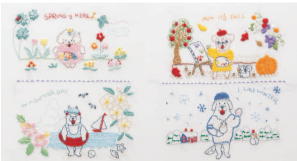
с. 48 Четыре времени года с. 49