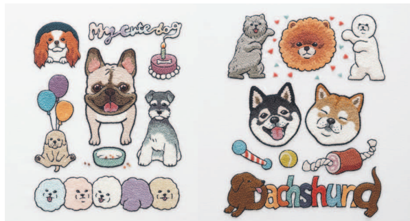
с. 20 Изумительные улыбки с. 21