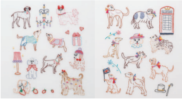
с. 36 Принарядимся для выхода в свет с. 37