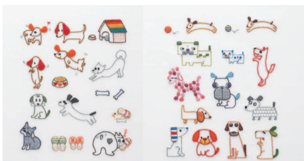
с. 32 Просто обожают дурачиться! с. 33