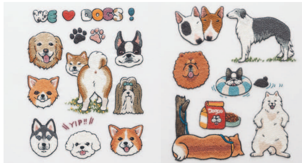
с. 22 Как таких не любить! с. 23