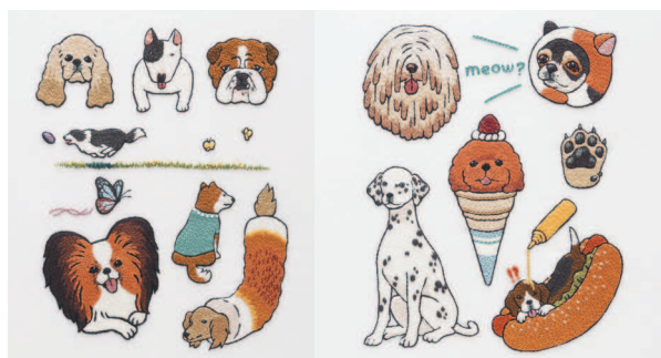
с. 24 Вы только посмотрите на него! с. 25