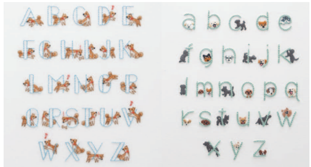
с. 42 Алфавит с. 43