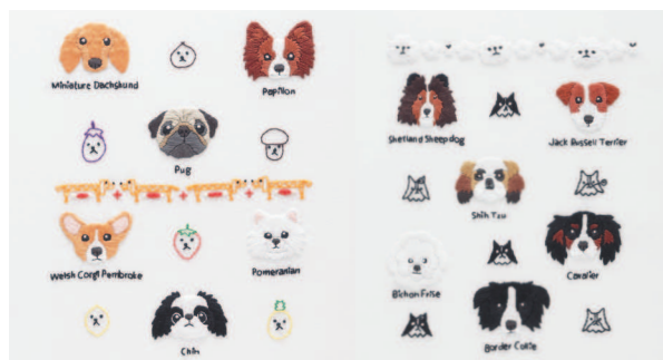
с. 26 Любимчики с. 27