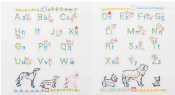
с. 44 Алфавит с. 45