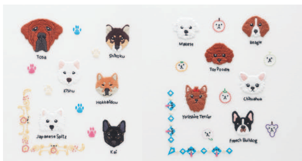
с. 28 От мала до велика с. 29