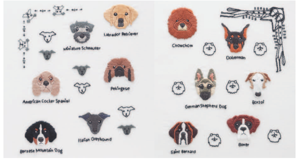
с. 38 Красавчики с. 39