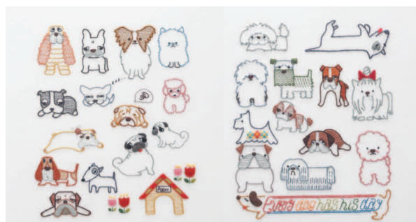
с. 30 Virtuозные актёры с. 31