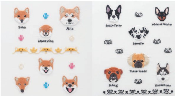
с. 40 Что за выражение мордочки! с. 41