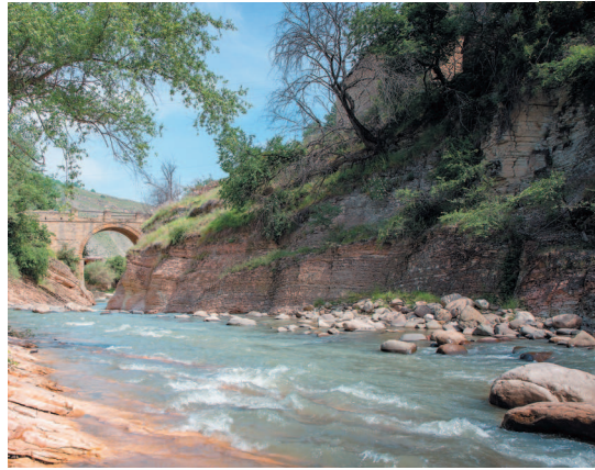
Река Уллучай имеет длину 111 км, а площадь ее бассейна – 1440 кв. км.

Каспийское море не такое соленое, как Черное или Средиземное.