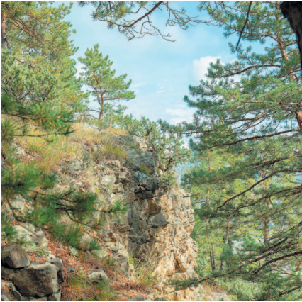
Сосновый лес в горах.