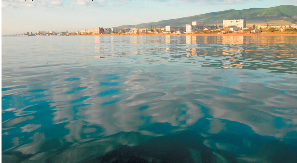
Вид на Дербент с Каспийского моря.

Удивительный обитатель Каспия – каспийский тюлень, или нерпа. Это редкий вымирающий вид, реликт ледникового периода. Селится он по берегам. Зимой тюлени мигрируют в северную, замерзающую часть. Могут подниматься по руслу рек, добираясь, иной раз, до Волгограда. Тюлени живут стаями. Численность их была велика. В начале XX века насчитывалось до миллиона особей. В конце 1980-х годов их было уже 400 тысяч, в 2008-м – 100 тысяч, в 2019-м – 43–66 тысяч. Вымирание, скорее всего, вызвано загрязнением моря нефтепродуктами.