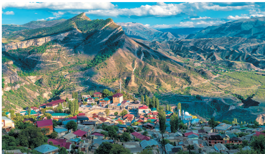
Горный хребет и красивая долина с селом.

Поскольку горообразование здесь находится в активной фазе, Дагестан является сейсмичным регионом. Мощное землетрясение 1970 года разрушило множество зданий в Махачкале, а в почве образовались трещины.