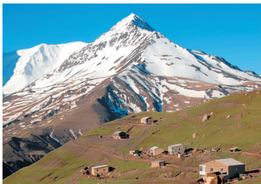
Село Куруш (самая южная точка России и самый высокогорный населенный пункт Европы, 2560 м) и гора Базардюзю (4466 м).

Самая высокая часть Дагестана – Боковой хребет. Перемычками он соединяется с Главным Кавказским хребтом, а между перемычками лежат труднодоступные котловины, днища которых находятся на высотах 1200–1700 метров. Рельеф здесь уже типично альпийский, с серыми скалистыми пиками и заснеженными гребнями.