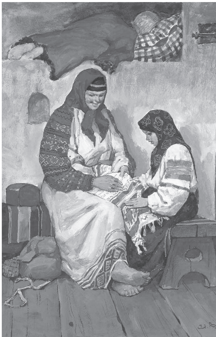
Художник С. Бабюк