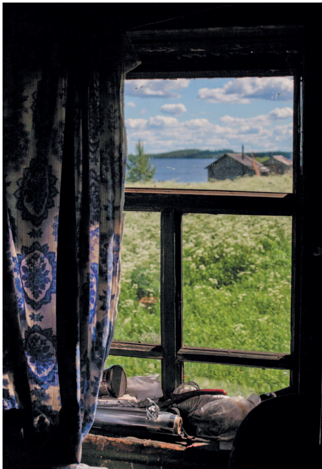
«Гляжу в озера синие»

Тут как-то на острове берлогу нашел, ну там небольшая, видать, муравейники собирает. Тут на мысу нашел берлогу в позапрошлом году, свежевывкопанную, еще не были в лежке, ну медведь по две, по три берлоги готовит.