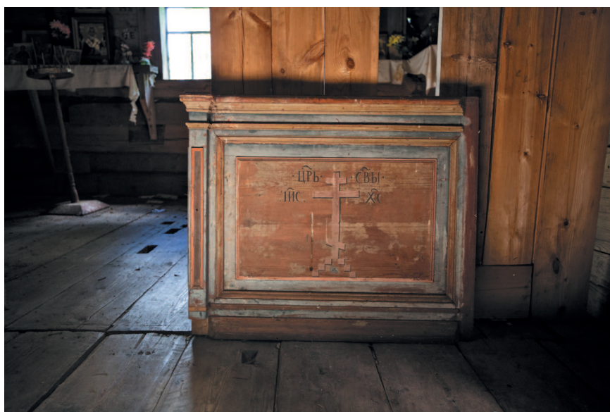
Интерьер Никольской церкви Троицкого монастыря, начало XVII века

морской обители был отписан и Троицкий монастырь, в котором тогда жили всего пять иноков. Представьте, какая это глушь была в те времена, если даже в XXI веке попасть на остров не так-то просто. Основал его преподобный Кассиан, который, согласно преданию, приплыл из Соловков на гранитной плите. Но предание преданием, а тем не менее осколки этой плиты до сих пор можно увидеть под огромной старинной елью. А раскололась плита в 70-х, когда на острове жили реставраторы и жгли на ней костер, что-то рубили... Называют и другие даты строительства Никольской церкви, но она точно была построена не позднее 1643 года, когда сведения о ней появились в документах. Остальные строения монастыря не сохранились, кроме двух крохотных часовен.