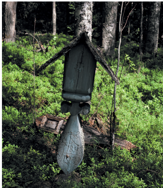
На острове Троица