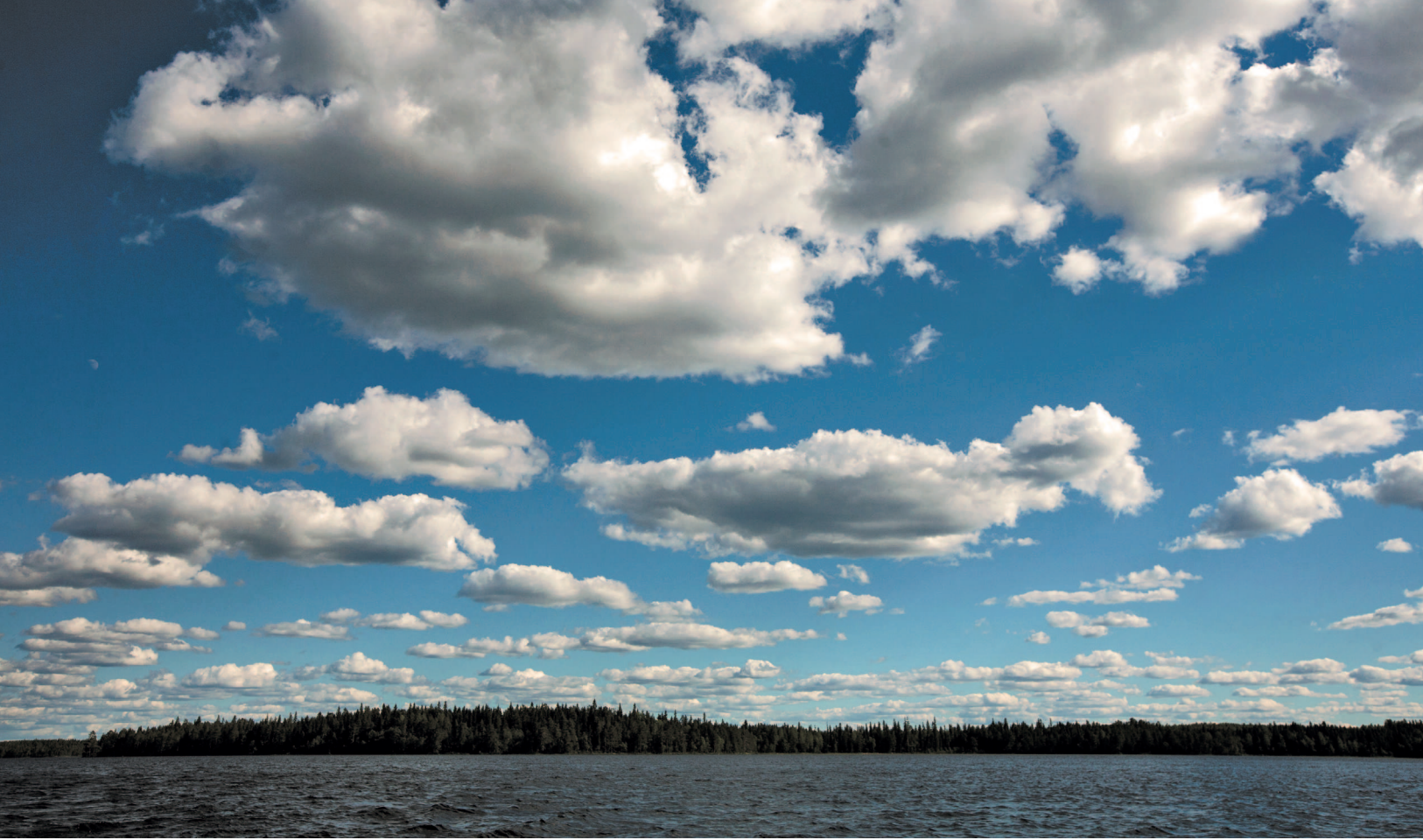
Небо над Муезером