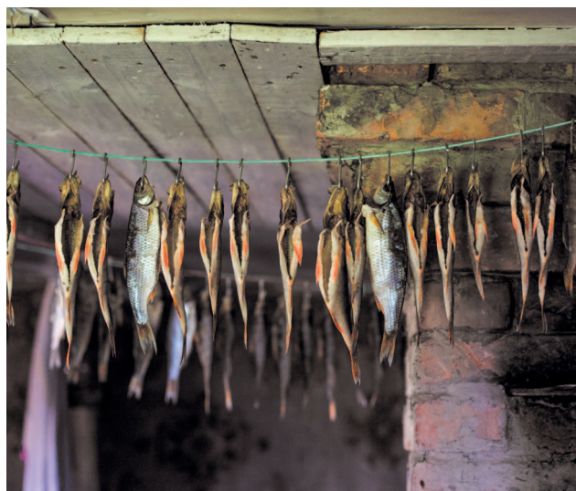
В рыбацкой избешке