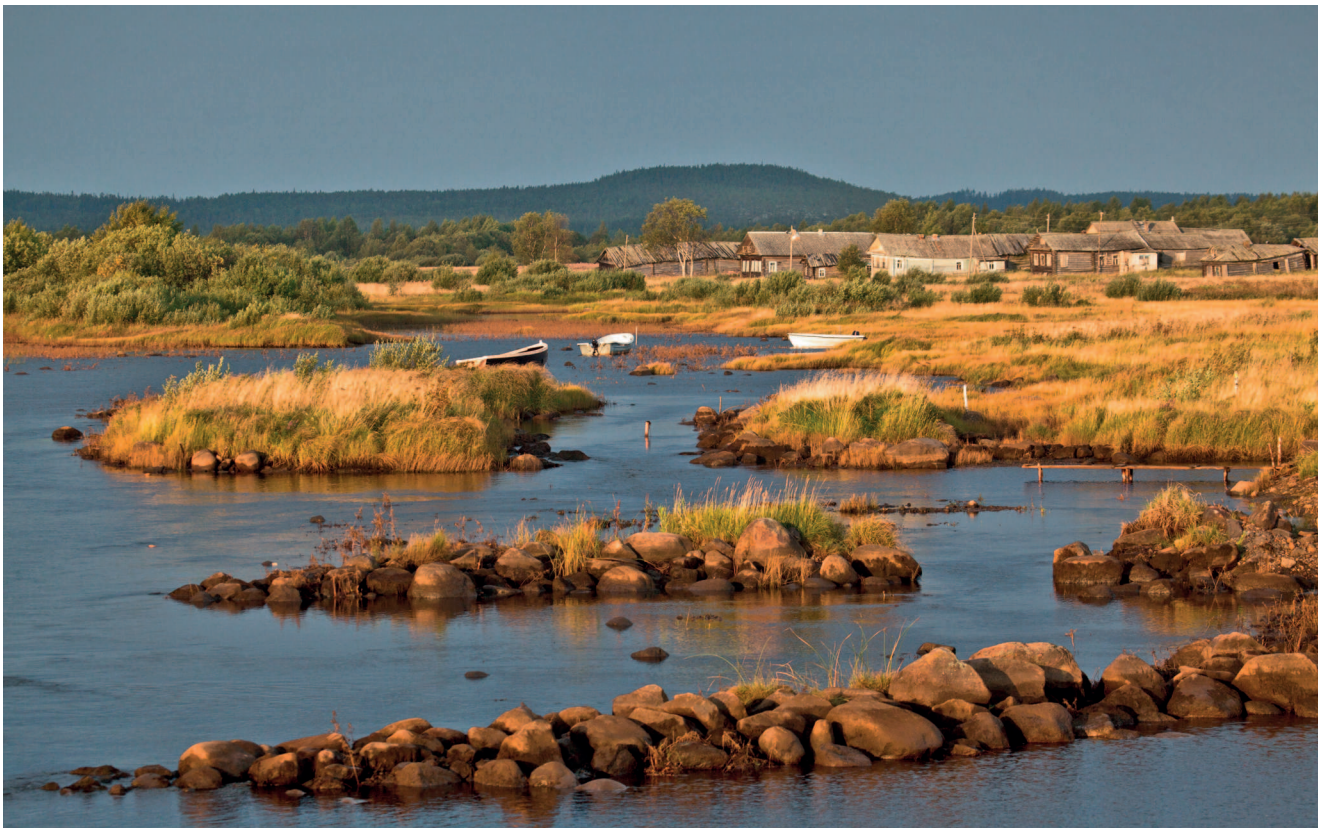
Рассвет на одноименной реке