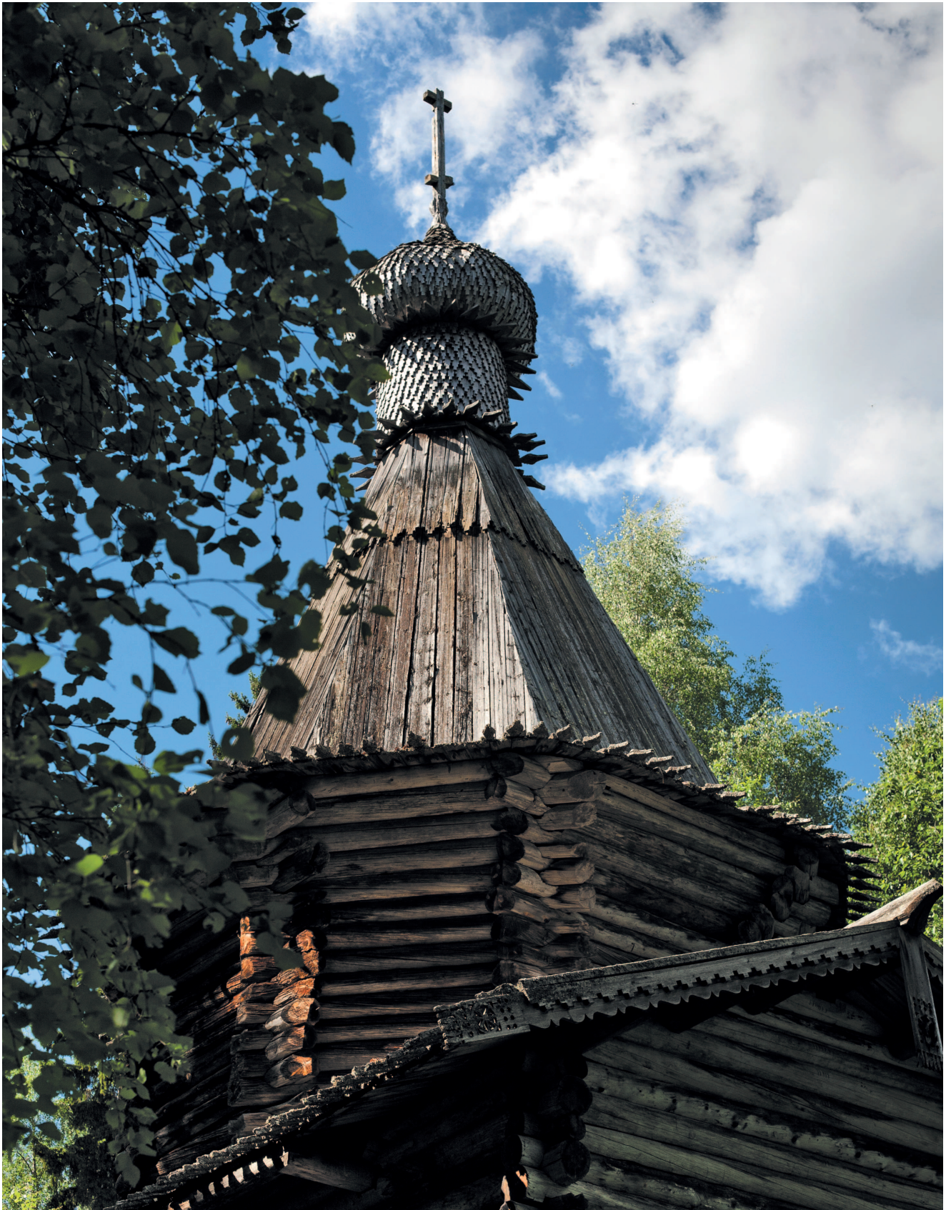
Никольская церковь Троицкого монастыря до реставрации, начало XVII века