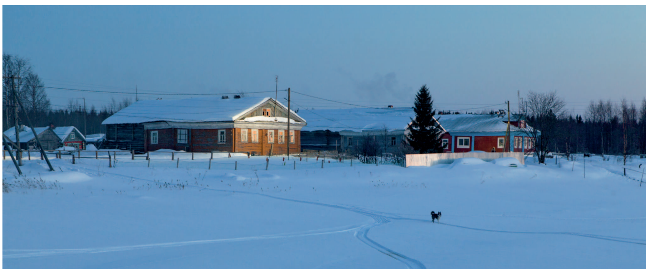
Один в поле

Еще в Вирме так говорили: «Чай пьют кума у кумы — в гости пришла. Налей ты мне еще! — Пей, кума, пятнадцатую, я ведь не считаю». А в Нюхче, мне рассказала Нюхоцкая, у них так говорили: «Сидит кума. Ну, кума, налей ты мне третью. — Седьму, кума, седьму, мне воды не жалко, а правда краше солнца, седьму, кума, седьму».