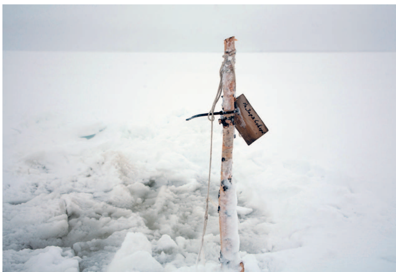
Колхоз «Заря Севера»