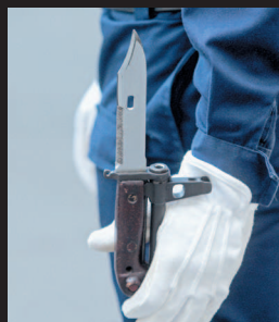
Штык-нож к АКМ и АК-74 образца 1978 года