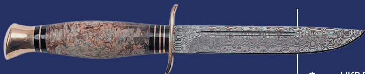
Финка НКВД, подарочный вариант

падающие под категорию холодного оружия.