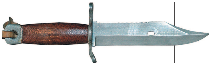
Экспериментальный нож Р.М. Тодорова образца 1956 года

Первая модель автомата Калашникова (АК), принятая на вооружение Советской армии в 1949 году, не имела штыка вообще. Только в 1953 году вместе с так называемым облегченным автоматом АК был принят на вооружение «штык-нож изделие 6Х2», который имел тот же клинок, что и штык к самозарядной винтовке СВТ-40, и отличался только механизмом фиксации. По отзывам специалистов, «штык-нож изделие 6Х2» был крайне удачной конструкцией. Имеются сведения, что отдельные «выжившие» экземпляры этого штыка применялись в первой чеченской войне, спустя более чем четверть века после снятия его с вооружения.