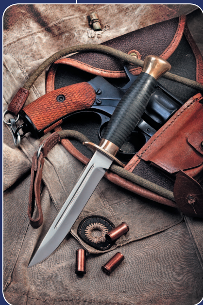
Финка НКВД, современная версия

Как упоминалось выше, выпускаются сувенирные и подарочные варианты «финки НКВД», не по-