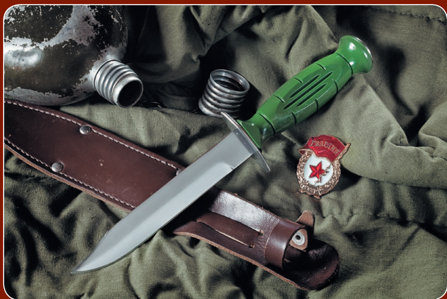
Нож армейский образца 1943 года «Вишня»

металлическим навершием — ежели чего, и клин забить, и врага по голове приласкать. Нож получил название «Вишня». Конструкция оказалась настолько удачной, что до сих пор находится на вооружении ряда российских спецподразделений.