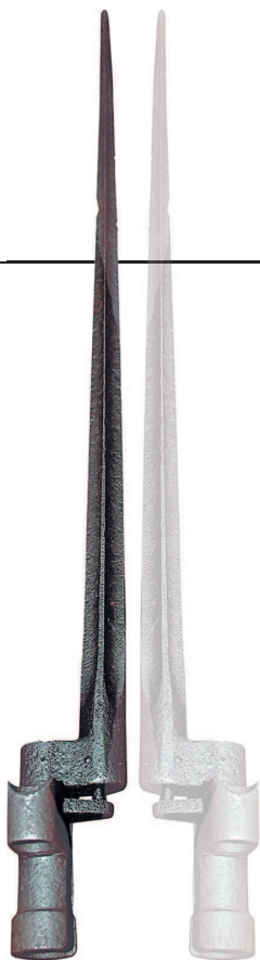
Штык к винтовке С.И. Мосина образца 1891-1930 годов

Анализируя историю России именно с точки зрения развития холодного оружия, поневоле приходишь к пониманию, откуда у русского человека такая любовь именно к ножу. Видимо, наше это, национальное, родное. С тех времен, когда, отбросив щиты, шли в ножевую атаку русские витязи.