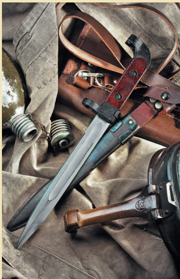
Штык к 7,62 мм автомату Калашникова образца 1949 года

Однако самым известным каждому жителю нашей страны русским боевым ножом является штык-нож к автомату Калашникова.