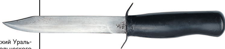
Нож армейский Уральского добровольческого танкового корпуса

Как раз перед Великой Отечественной войной родилось оружие русских воинов, не менее легендарное, чем штык к винтовке Мосина, — знаменитый НА-40 («нож армейский») или НК-40 («нож разведчика»), принятый на вооружение в 1940 году, сразу после советско-финской войны. Второе более популярное, но исторически менее верное название обусловлено тем, что этим ножом вооружались разведроты и подразделения автоматчиков.