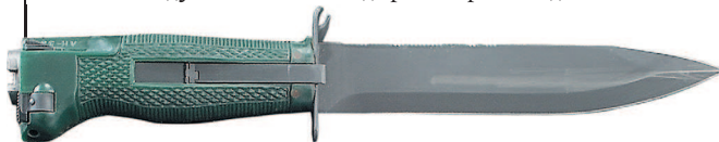
Нож разведчика специальный-2 (НРС-2)

В 1986 году НРС был модернизирован до НРС-2.