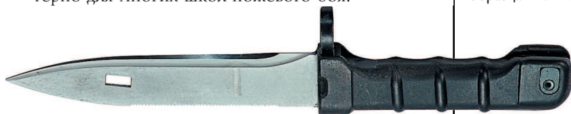
Штык-нож к АК-74 образца 1989 года

Инженеры Ижевского завода, создавшие последний образец штатного штык-ножа, считают, что данный способ крепления поможет избежать застревания клинка меж ребер противника. И, возможно, в этом есть свой определенный резон, ведь подобное положение клинка характерно для многих школ ножевого боя.