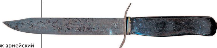
Нож армейский (НА-40)

Как раз перед Великой Отечественной войной родилось оружие русских воинов, не менее легендарное, чем штык к винтовке Мосина, — знаменитый НА-40 («нож армейский») или НК-40 («нож разведчика»), принятый на вооружение в 1940 году, сразу после советско-финской войны. Второе более популярное, но исторически менее верное название обусловлено тем, что этим ножом вооружались разведроты и подразделения автоматчиков.