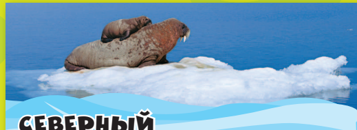
СЕВЕРНЫЙ ЛЕДОВИТЫЙ ОКЕАН

Здесь ты прочитаешь о секретах обитателей вод, расположенных между Гренландией и Исландией на севере, Европой и Африкой на востоке, обеими Америками на западе и Антарктидой на юге.