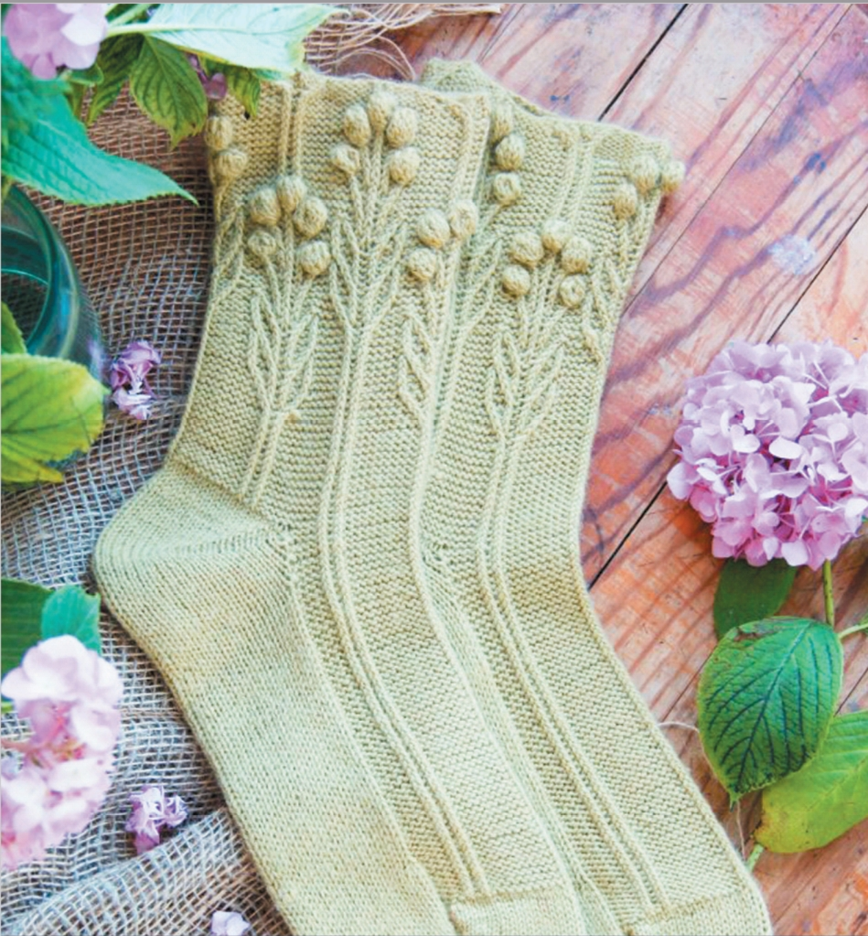
Носки «Цветочная грядка»