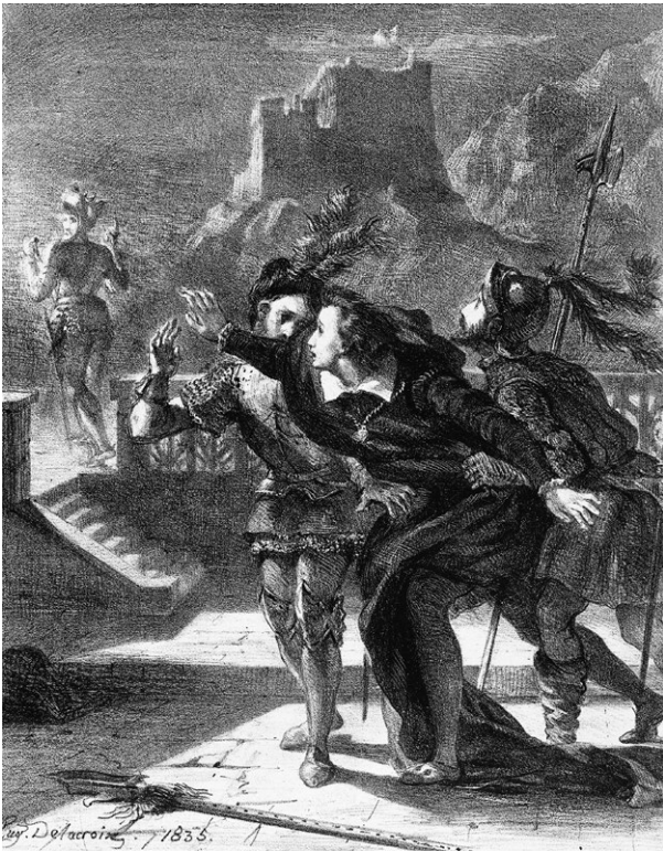
Гамлет пытается последовать за призраком своего отца

Написанная прежде всего для того, чтобы у нас с вами (у меня — в процессе письма, у вас — во время чтения) был повод поразмышлять о собственной культуре и истории. Искренне надеюсь, что мои рассказы доставят читателю такое же удовольствие, какое они доставили автору.