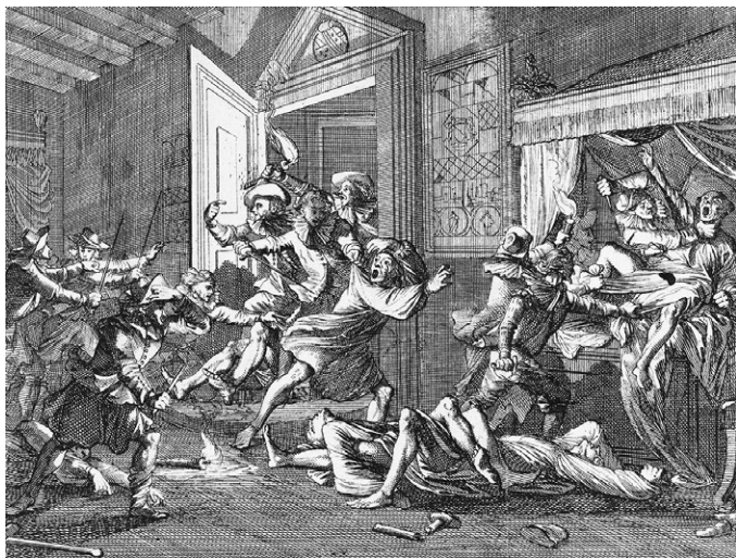
Убийство тамплиеров в Зиерикзее в 1312 году

Так что свой рассказ я буду вести как рассказ о шахматной партии. Не обычной партии, ведь играли не двое, а трое: Филипп — король Франции, Жак — магистр ордена Храма, Климент — папа. Кто из них играл белыми — решать вам.