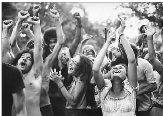
Слушатели Гомера, примерно 700 лет до н. э. 9

До повсеместного распространения грамотности слушатели были заворожены магией поэтического языка, и слушание таких поэтов, как Гомер, вводило людей в состояние почти транса. Это было «полное погружение в эмоциональное и телесное сопереживание» 8 .