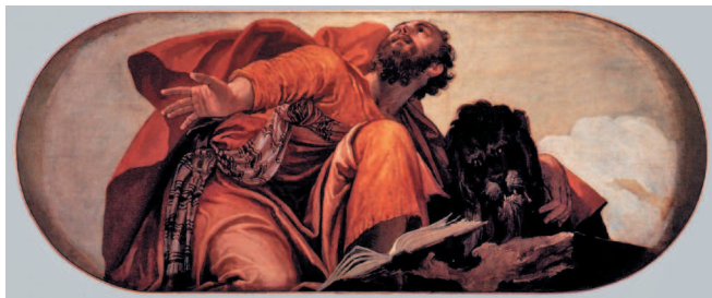
Паоло Веронезе. Святой Марк. 1556/57. Церковь Сан-Себастьяно, Венеция

мастеров и добиваясь портретного сходства, рисуя с натуры. Разумеется, он изучал картины и фрески, украшавшие миланские церкви. И, конечно, не прошел мимо «Тайной вечери» Леонардо, почитавшейся шедевром еще при жизни автора. По всей видимости, Петерцано был отличным учителем, иначе откуда бы что взялось? Другое дело, что, увы, безуспешны оказались попытки современных ученых отыскать рисунки молодого Караваджо в архиве его учителя (он хранится в миланском замке Сфорцеско). И поэтому кажется,