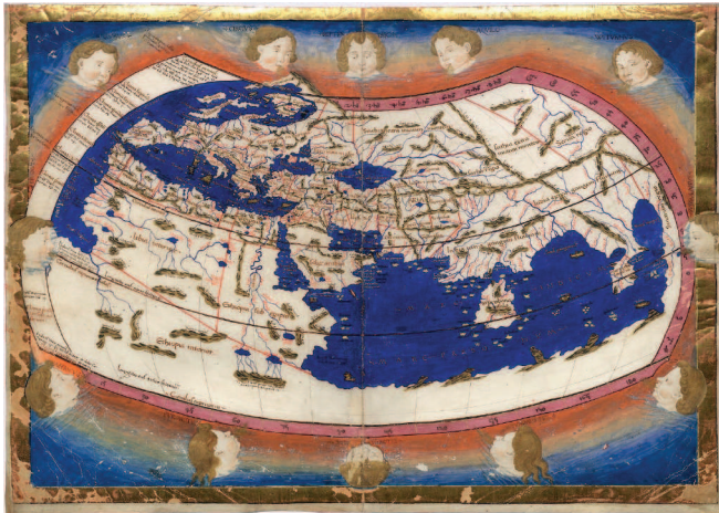
Карта мира Птолемея (II век) в реконструкции Николая Германа (XV век)

XVI век проверял на прочность все, что казалось незыблемым. Великие географические открытия расширили границы бытия и оказалось, что старый, хорошо изведанный свет — это еще не вся вселенная. Где-то за океаном были обнаружены острова и материки с невиданными культурами. Все боль-