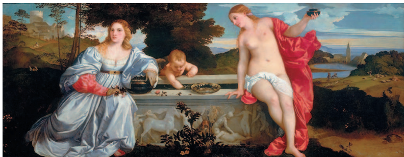
Тициан. Любовь небесная и Любовь земная. Ок. 1514

мастеров и добиваясь портретного сходства, рисуя с натуры. Разумеется, он изучал картины и фрески, украшавшие миланские церкви. И, конечно, не прошел мимо «Тайной вечери» Леонардо, почитавшейся шедевром еще при жизни автора. По всей видимости, Петерцано был отличным учителем, иначе откуда бы что взялось? Другое дело, что, увы, безуспешны оказались попытки современных ученых отыскать рисунки молодого Караваджо в архиве его учителя (он хранится в миланском замке Сфорцеско). И поэтому кажется,