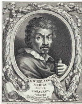
Портрет Караваджо по рисунку Оттавио Леони. XVII век. Коллекция Бертарелли, Милан

просветленные лица в совершенных декорациях, часто на фоне вымышленного пейзажа. В эту идеальную воду бросили камень, и появилась «змеиная линия» маньеризма, а чуть позже — римское барокко. Первым его живописцем и стал Микеланджело Меризи да Караваджо. Впрочем, невозможно ограничить его только этим периодом. Эпоха, когда мир усомнился в себе, осознав свое причудливое несовершенство, продолжается и сегодня. А значит, остается современным художником и Караваджо.