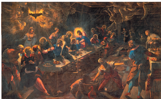
Тинторетто. Тайная вечеря. 1592/94. Церковь Сан-Джорджо Маджоре, Венеция