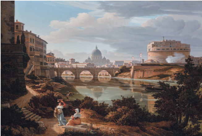
Рудольф Вигманн. Сан-Пьетро и Кастель-Сант-Анджело. 1834

Увидев Рим и как он в блеск убран, Дивились, созерцая величавый Над миром вознесенный Латеран...*