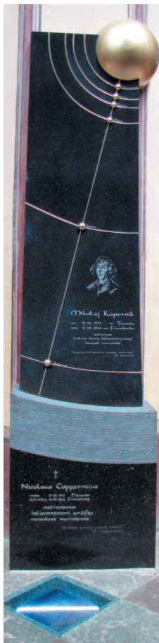
Могила Николая Коперника во Фромборкском соборе

Работы гениев Чинквеченто — прежде всего, Леонардо, Рафаэля и Микеланджело — все еще почитались как высочайшие достижения искусства, но изображенное ими показывало недостижимый, несуществующий, идеальный мир. Все это были, в основном,