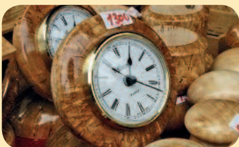
■ Изделия из карельской березы

Это, казалось бы, самое распространенное российское дерево в Карелии обладает уникальными свойствами – золотистым цветом и рисунком, напоминающим мрамор. За твердость и прочность в старину его называли «Царским деревом». Из березы делают вазы, визитницы, зажигалки, блюда, шкатулки, шахматы и авторучки. Владелец такой вещицы может с уверенностью сказать: «Я был в Карелии».