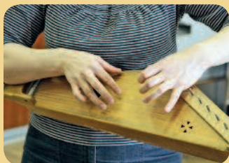
■ Так выглядит кантеле

Посетите «Дом кантеле» в Петрозаводске. Карельский язык сейчас не часто можно услышать на улице, поэтому сюда стоит сходить на концерт ансамбля песни и пляски «Кантеле». Во время выступления вы услышите игру на таких редких инструментах, как кантеле, варган, йоухикко, сигудек, вирсиканнель, талхарпу, пярэ, шаманские бубны, а также песни на северных диалектах русского языка, карельском, вепсском и финском языках. В местном магазине можно купить кантеле – старинный карельский музыкальный инструмент, напоминающий русские гусли.