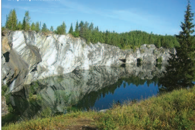
■ Мраморный каньон