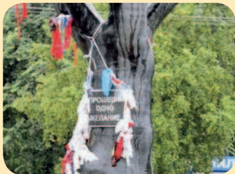
■ Дерево желаний

На Онежской набережной в Петрозаводске раскинуло ветви «Дерево желаний» – подарок шведского города-побратима Умео. Это настоящая сосна, покрытая стеклотканью. На черном стволе прикреплено огромное белое ухо и табличка с надписью «Прошепчи одно желание». Здесь следует задумать желание и потихоньку произнести его в ухо. На ветвях дерева висят колокольчики. Если после того, как желание было загадано, колокольчики начинают звенеть, значит, оно сбывается.