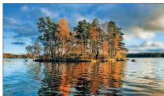
■ Озеро Вуокса