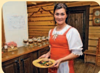
■ Официантка в национальном костюме

Невозможно побывать в столице Карелии и не посетить петрозаводский ресторан «Карельская горница», где можно реально ощутить дух карельской деревни и попробовать национальные блюда. За порогом вы оказываетесь в горнице крестьянской избы, стены которой сложены из мощных бревен. Вдоль стен стоят лавки, покрытые половиками. В углу за ткацким станком примостилась бабушка-ткачиха (манекен). Карелия богата озерами и реками, а значит, и рыбой. В ресторане готовят сига, судака, окуня, щуку и налима. Обязательно попробуйте блюдо под названием «Лумиваара» – рыбу, запеченную целиком в соленом коконе, или жаркое «Хирви» из лосятины, тушенной в горшочке под крышкой из дрожжевого теста.