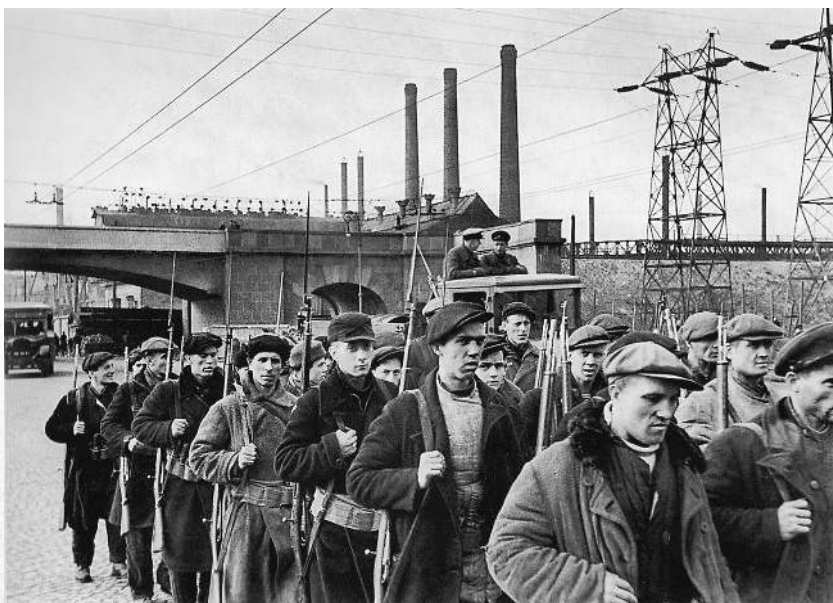
Рабочий отряд. 25 сентября 1941 г.

и оборонных объектов города, а также (с одобрения Сталина) план уничтожения кораблей Балтийского флота и судов торгового флота. Прилетевший в Ленинград 10 сентября Жуков прикажет отменить минирование кораблей. В 1950 году он вспомнит: “Как вообще можно минировать корабли? Да, возможно, они погибнут. Но если так, они должны погибнуть только в бою, стреляя. И когда потом немцы пошли в наступление на приморском участке фронта, моряки так дали по ним со своих кораблей, что они просто-напросто бежали. Еще бы! 16-дюймовые орудия! Представляете