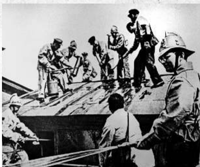
Композитор Дмитрий Шостакович (первый справа) в дни блокады Ленинграда во время Великой Отечественной войны был бойцом добровольной противопожарной команды и дежурил на крыше консерватории. 1941 г.

* Достигли высшего накала бои под Ленинградом в районе Вороньей горы. В этот день стоявшая там советская артиллерия отразила 10 атак танков и пехоты. Это была так называемая батарея «А», вооруженная 9 орудиями, снятыми с крейсера «Аврора» (отсюда и название); она состояла из 200 человек тоже, главным образом, моряков с «Авроры», а также артиллеристов Кронштадта и Ленинграда. В неравной схватке погибли