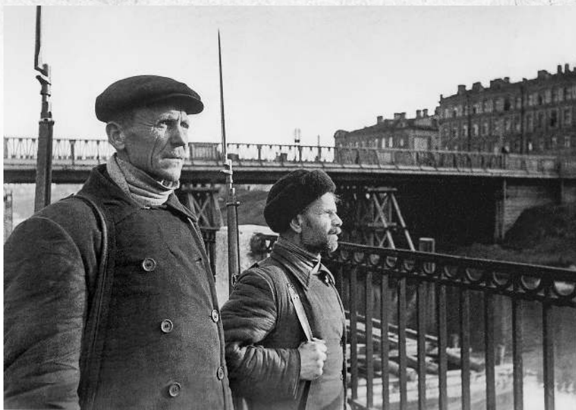
Патруль. 24 октября 1941 г.

Однако, по воспоминаниям очевидца, Ворошилов всего-навсего вышел из машины, поговорил с командиром подразделения, который, крутя ус, пообещал, что сейчас поднимет дивизию в бой. А дивизия эта — необстрелянная дивизия народного ополчения, состоявшая из пожилых или совсем молодых людей, с одной винтовкой на пятерых, под огнем противника лежала в окопах. Ворошилов мрачно заметил усатому командиру, что, видимо, только присутствие маршала подвигло его принять решение перейти в наступление. Английский журналист Александр Верт выскажет предположение, будто Ворошилов, осознавая свою