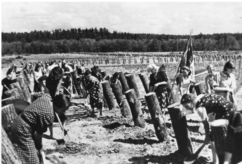
Строительство оборонительных сооружений. 1941 г.

4 июля части вермахта вступили в Ленинградскую область, форсировав реку Великая и преодолев укрепле-