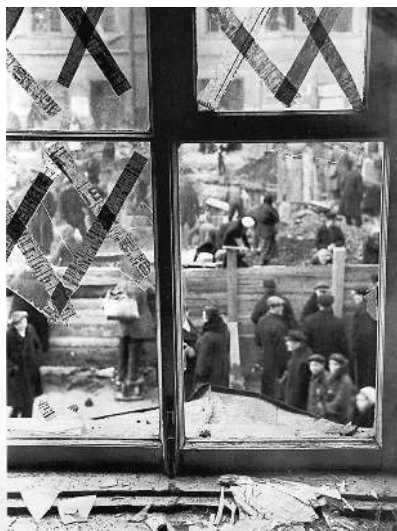
Окно Театра юного зрителя после немецкой бомбежки. 5 октября 1941 г.

подготовить план захвата Ленинграда не позднее сентября 1941 года. В беседах с военачальниками фюрер помимо чисто военных доводов привёл немало политических аргументов. Он полагал, что захват Ленинграда даст не только военный выигрыш (контроль над всеми балтийскими побережьями и уничтожение Балтийского флота), но и принесёт огромные политические дивиденды. Советский Союз потеряет город, который, являясь колыбелью Октябрьской революции, имеет для советского государства особый символический смысл. Кроме того, Гитлер считал очень важным не дать советскому командованию