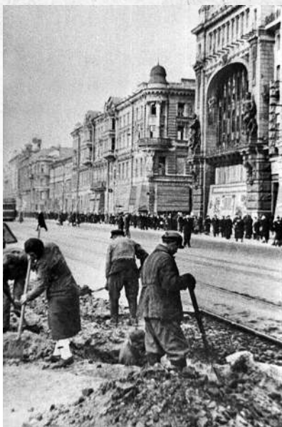
Невский проспект осенью 1941 г.

Во время этого налета произошел один из самых таинственных и трагических случаев за всю Ленинградскую блокаду: сгорели Бадаевские продуктовые склады. Советские историки уверяли, что сгорели они в результате налета: склады деревянные, располагались кучно. Однако в этом происшествии было несколько очень странных моментов. Все пожары в ту ночь были довольно быстро потушены – кроме Бадаевского: склады горели более 5 часов. Почему продукты, уже в условиях блокады, хранились так небрежно, почему не была усилена их пожарная часть? Пожарная охрана города насчитывала уже почти 12 тысяч человек (это помимо рядовых жителей, которые каждую ночь дежурили на крышах своих домов). Зато загоревшиеся Бадаевские склады сразу же были оцеплены войсками НКВД, которые выстрелами отгоняли ленинградцев, сбжавшихся наскрести хоть немного горелой муки. Далее, советские историки уверяли: версия о том, что пожар на Бадаевских складах был одной из главных причин голода,