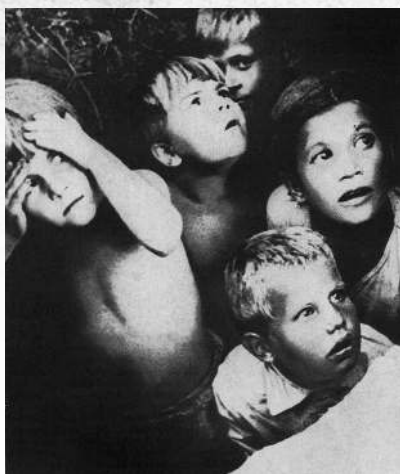
Дети, прячущиеся от бомбардировки. Лето 1941 г.

ния «Линии Сталина» в направлении на Остров. 9 июля был занят Псков (280 километров от Ленинграда). 19 июля, к моменту выхода передовых немецких частей, на Лужском оборонительном рубеже уже были построены оборонительные сооружения протяжённостью 175 километров и общей глубиной 10–15 километров. Днём и ночью работали здесь ленинградцы, в основном женщины и подростки.