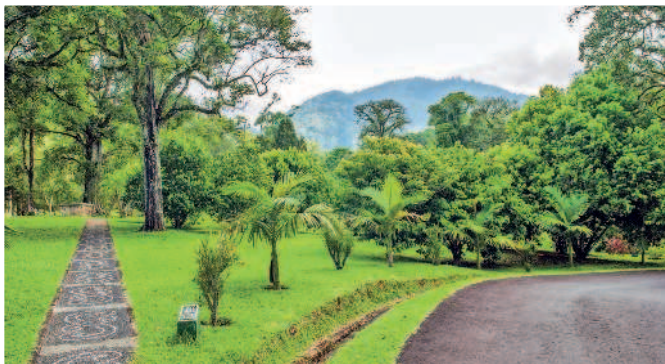
Ботанический сад Бали