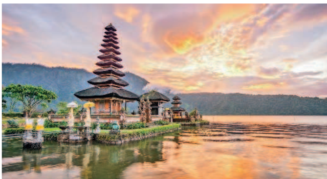
Храм Улун Дану

Кстати, в горной части полно фешенебельных или совсем дешевых отелычиков – на любой вкус. Вот где действительно можно почувствовать себя отшельником для познания новых истин!