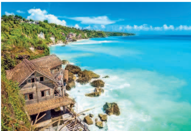
Индийский океан в солнечный день