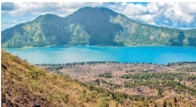
Озеро Батур и вулкан Гунунг-Батур

...Каждый храм здесь состоит как бы из трех частей: для злого духа, для человека и для святого духа. К слову, петушиные бои тоже проводятся в храмах, в местах именно для злого духа – проливанием петушиной крови эти духи задабриваются (подобное кормится подобным), и таким образом люди оберегают себя от несчастий (так кидают кость собаке, чтобы не укусила).