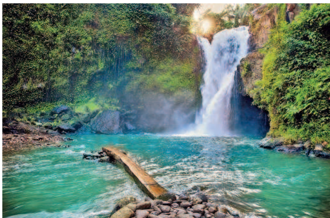
Водопад Тегенгунган. Тайные балийские джунгли

Обязательно стоит попробовать научиться. Для начинающих существует бодибот (body board). Эдакая предварительная серфинговая пластиковая досочка, «трехколесный велосипед», 40 на 100 см. При приближении волны прыгаешь на нее животом (стоит надеть майку от кровоподтеков на груди и ласты