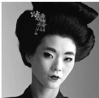
Повседневный макияж гейши

В представлении японцев белая кожа – символ красоты и привлекательности. Белое лицо и шея – обязательные атрибуты макияжа гейши с 17 века (когда появились женщины-гейши, а до этого роль развлекателя исполняли мужчины – актеры и музыканты театра Кабуки).