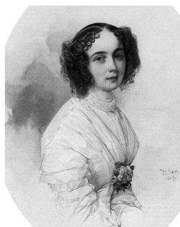
Гау В. И. «Елизавета Полетика» (1849), фрагмент