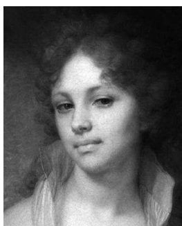
Боровиковский В. Л. Портрет М. И. Лопухиной (1797), фрагмент