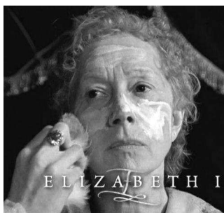
Кадр из фильма «Елизавета I», в роли Елизаветы – актриса Хелен Мирен

В представлении японцев белая кожа – символ красоты и привлекательности. Белое лицо и шея – обязательные атрибуты макияжа гейши с 17 века (когда появились женщины-гейши, а до этого роль развлекателя исполняли мужчины – актеры и музыканты театра Кабуки).