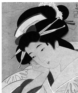
Китагава Утамаро. «Большая гейша» (1905)