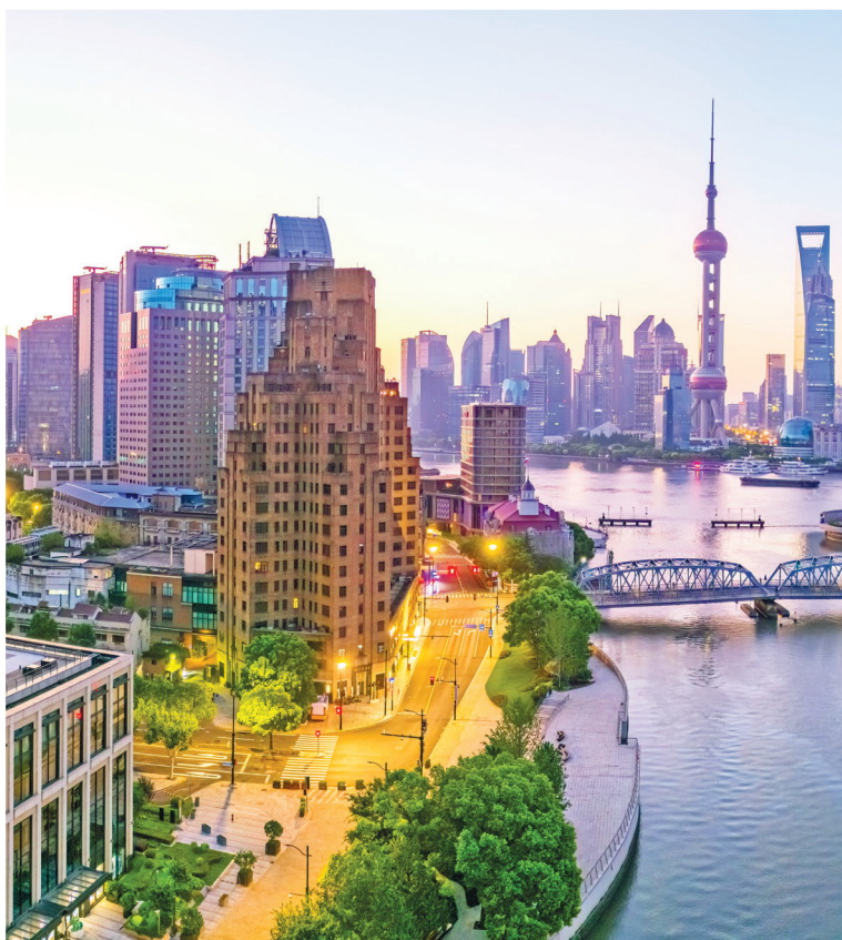
Вид с воздуха на горизонт Шанхая на восходе солнца

Каждые 15 минут поезд на магнитной подушке Maglev отправляется из Международного аэропорта Пудун в центр города, развивая скорость до 300 километров в час. Все остальное в Шанхае происходит примерно в том же темпе. Стремительно развиваясь, Шанхай не стесняясь демонстрирует всем свое процветание. Его современные районы похожи на декорации к межгалактическим голливудским боевикам. В Шанхае есть небоскреб Tomorrow Square — «Площадь Завтраш-