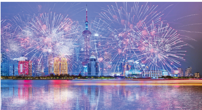
Новогодний салют в Шанхае