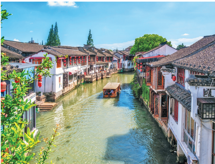
Водный городок Чжуцзяцзяо

Вечер. Вечер, пожалуй, лучшее время, чтобы подняться на одну из смотровых площадок Пудуна с видами на залитый огнями город. Отдайте предпочтение Шанхайской башне (▷56) с самой высокой в мире смотровой площадкой на высоте 546 метров. Еще выше над ней расположен ресторан Heavenly Jin (▷57), который накормит вас ужином на заоблачной высоте.