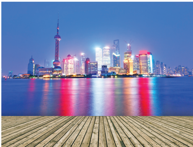
Вид с набережной Бунд

Вторая половина дня. Хотите узнать, почему Шанхай называли Восточным Парижем, — тогда отправляйтесь во Французский квартал, он же Французская концессия (▷28), сохранившая не только облик, но, кажется, и саму атмосферу «ревущих 1920-х». Самое колоритное место концессии — район Синьтяньди с модными барами, кафе, дорогими ресторанами и бутиками.