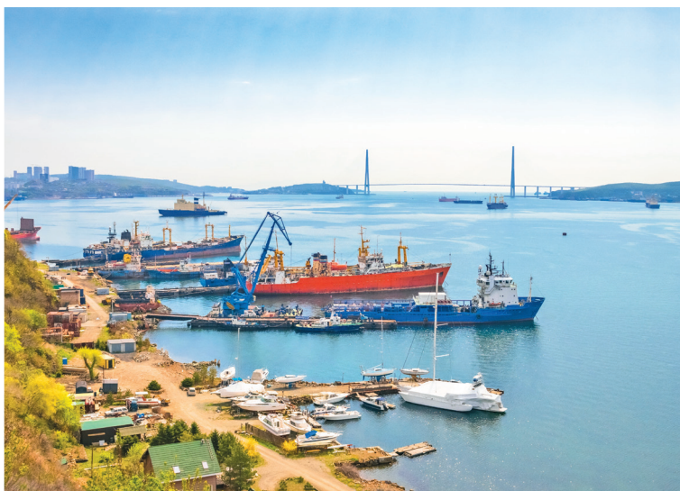
Вид на мост Русский

Вечер. Ресторан Uliss Asia (▷39) на 14-м этаже отеля «Родина» порадует вас не только превосходной кухней из свежайших морепродуктов, но и восхитительным закатом над Амурским заливом.