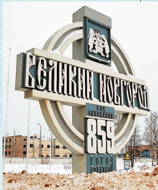
Знак на въезде в Великий Новгород.

Новгород делился на пять концов. Три из этих концов — Неревской, Людин и Славенский — являются прямыми наследниками тех самых трех поселков племенной аристократии, с которых и начался Новгород. Позднее