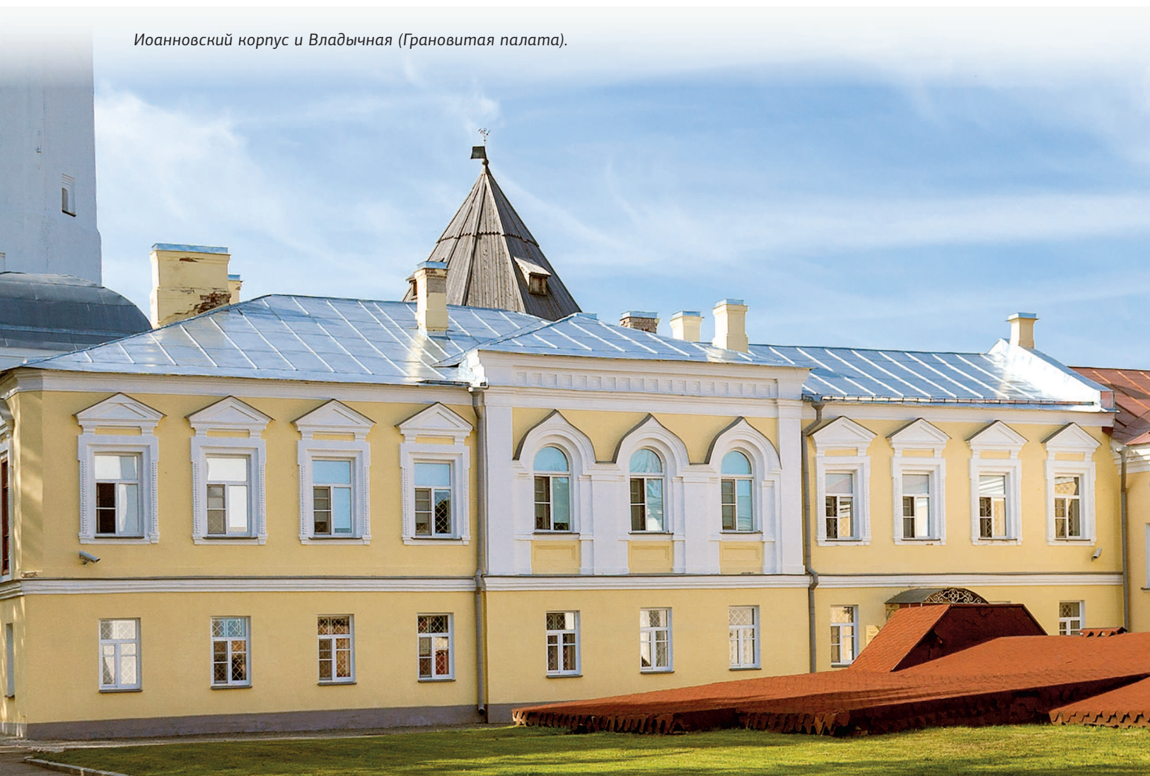
Иоанновский корпус и Владычная (Грановитая палата).

Переход Новгорода под власть Москвы имел не только минусы, но и плюсы. Москва активно вкладывалась в строительство в городе (так, именно в это время возводятся те укрепления Детинца, которые мы можем видеть сегодня). Благодаря вмешательству Москвы в конце XV столетия отменили