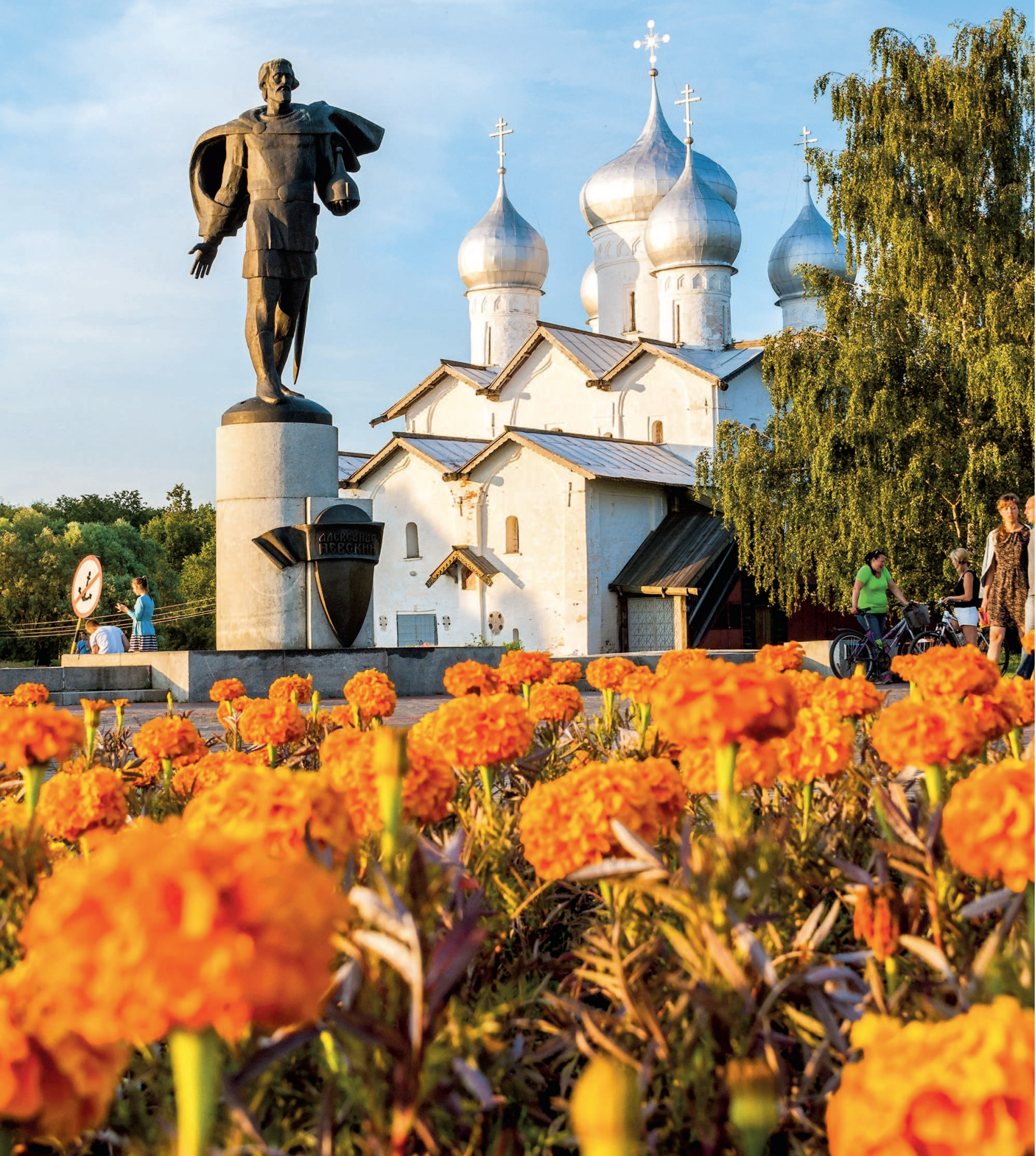
Памятник Александру Невскому перед Церковью Бориса и Глеба в Плотниках. Автор Юрий Чернов