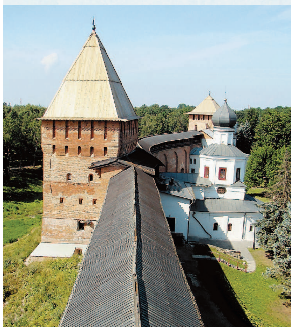
Крепостная стена и церковь Покрова Богородицы.

Великий Новгород известен как одна из первых столиц Руси, сохранившая уникальные памятники домонгольской архитектуры, благодаря тому, что не был захвачен монголами. В городе на реке Волхов найдено самое большое количество берестяных грамот — древних писем, а его исторические памятники признаны объектом Всемирного наследия ЮНЕСКО. Здесь также происходит действие былины о Садко и находится древнейший сохранившийся православный храм России — Софийский собор.