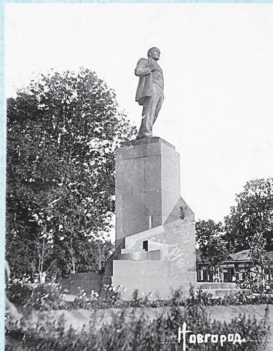
Памятник В.И. Ленину на старой открытке.

Пройдя по Людогоще улице, мы выходим на Софийскую площадь. Впереди мы видим памятник Ленину . Изначально он был установлен в 1928 году. Его авторами были скульптор Н.И. Шильников и архитектор Д.П. Осипов. Фигура Ленина стояла на высоком постаменте, который обвивала спираль. На ней были выбиты рельефы, символически изображающие развитие революционного движения от 1905 года к мировому Ок-