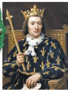
Портрет Карла V

XI в. Париж становится одним из крупнейших европейских центров образования и искусства. В 1257 г. каноник Роберт де Сорбон основал колледж, ставший впоследствии университетом Сорбонна.