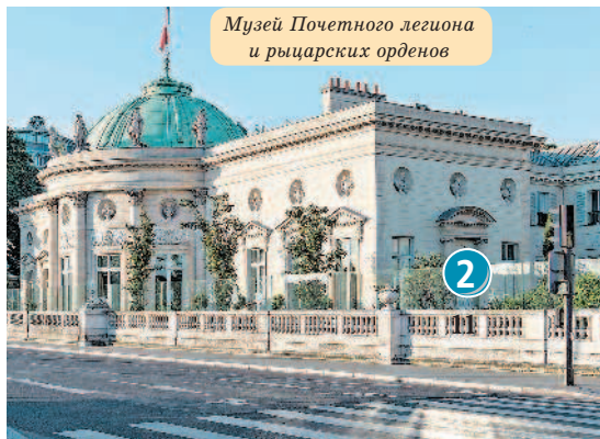
Музей Почетного легиона и рыцарских орденов

Напротив Музея Орсе находится не менее интересный и познавательный 2 Музей Почетного легиона и рыцарских орденов (2, rue de la Légion d'honneur; ☎ ср.–вс. с 13:00 до 18:00, пн. – выходной, вт. – посещение групп. Для групп необходимо предварительное бронирование, посещение с экскурсоводом – 170€, с аудиогидом бесплатно; ✨ legiondhonneur.fr ). Музей расположен в дворцовом комплексе, построенном архитектором Пьером Руссо в 1787 г. Здание предназначалось для городской резиденции семьи Сальмов. Во время Великой французской революции князь Фридрих Сальм был казнен, а сам дворец сначала был конфискован в казну, а затем возвращен кредиторам в уплату огромных долгов покойного. В годы существования Директории дворец был пристанищем для Сальмского клуба, который возглавляла мадам де Сталь.