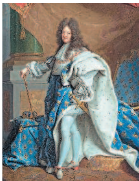
Людовик XIV де Бурбон