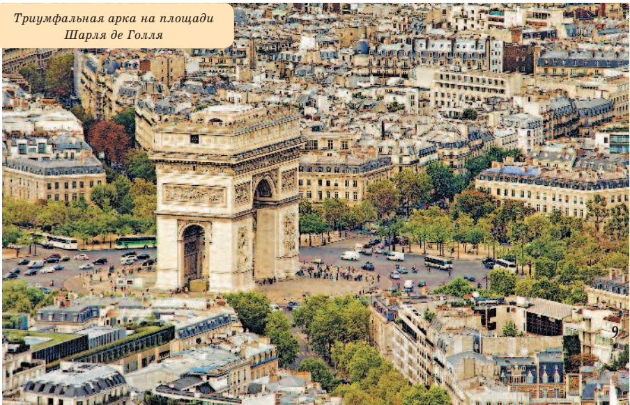
Триумфальная арка на площади Шарля де Голля

Главный политический, экономический и культурный центр Франции и сегодня остается стильным и элегантным. В его архитектурных памятниках запечатлена история, которой дышат узкие улочки старинных кварталов. Открывая Париж квартал за кварталом, вы познакомитесь с более чем 300 его достопримечательностями и совершите путешествие не только в пространстве, но и во времени.