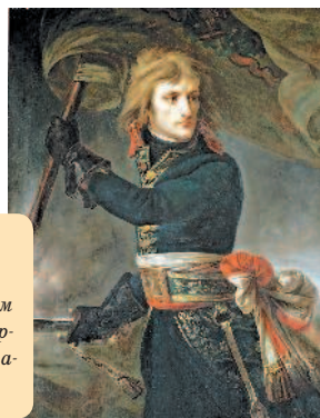
«Наполеон Бонапарт на Аркольском мосту» – картина Антуана-Жана Гро

Людовика XI город постепенно возвращал свой прежний блеск, а парижане вновь обретали вкус к роскоши.