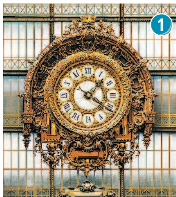
Часы в зале Музея Орсе

На арендованном велосипеде системы Vélib' Стоянка № 7007, по адресу Лилльская ул., 62 (62, rue de Lille).