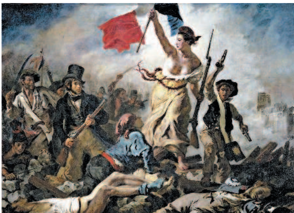
«Свобода, ведущая народ» ( La Liberté guidant le peuple ) – картина французского художника Эжена Делакруа, созданная по мотивам июльской революции 1830 г., положившей конец режиму Реставрации монархии Бурбонов