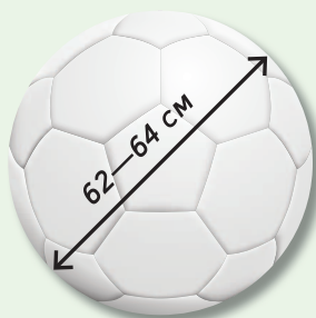
Масса — 400—440 г. Для детей от 12 лет