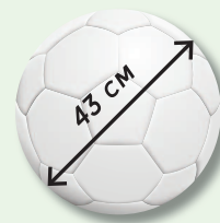
Масса — 200—220 г. Сувенирный/детский