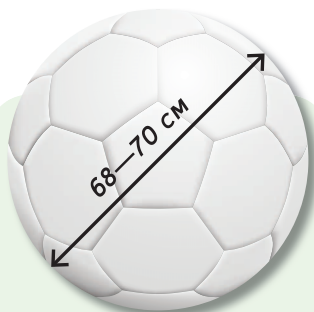
Масса — 450 г. Стандартный футбольный мяч для взрослых