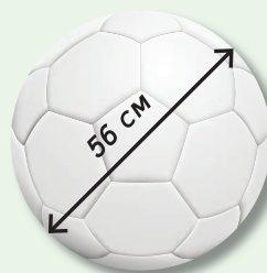
Масса — 283,5 г. Для детей до 8 лет