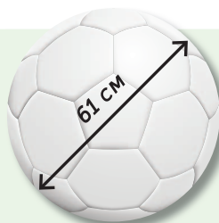
Масса — 340 г. Для детей до 12 лет