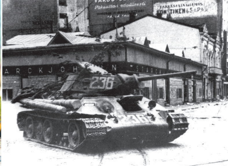
Средний танк Т-34 в Выборге, июнь 1944 г.

средств радиосвязи, неудовлетворительное снабжение боеприпасами, запчастями и ГСМ.