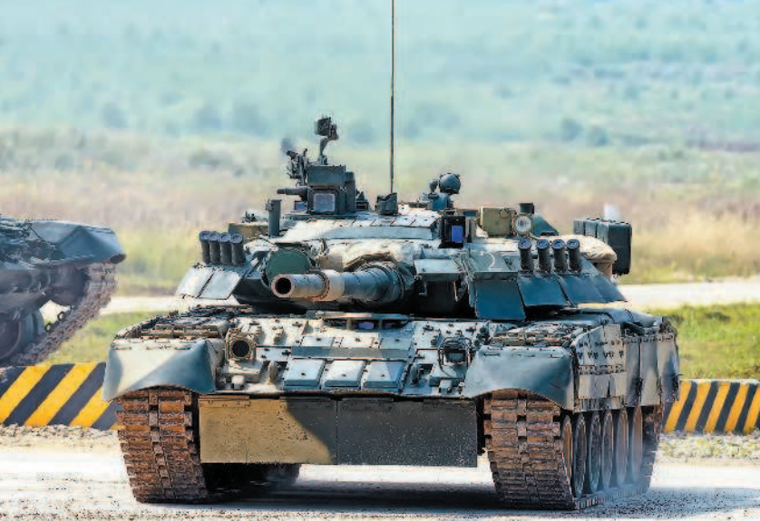
Основной боевой танк Т-72