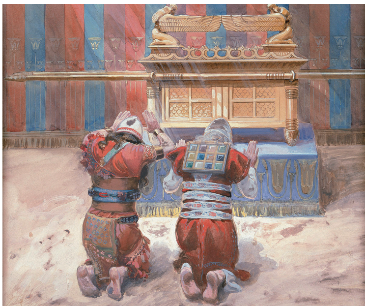
Джеймс Тиссо. Моисей и Иисус Навин перед Ковчегом Завета. Конец XIX — начало XX в. Еврейский музей. Нью-Йорк, США