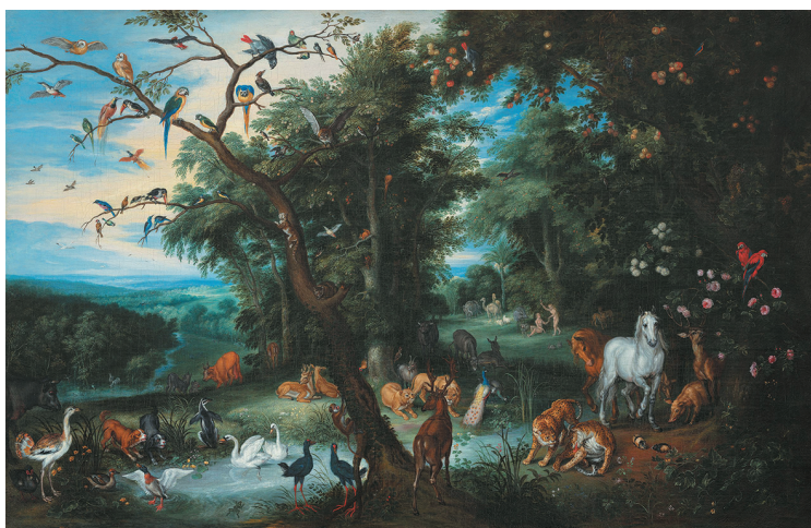
Исаак ван Остен. Эдемский сад. XVII в. Музей искусств. Толидо, США