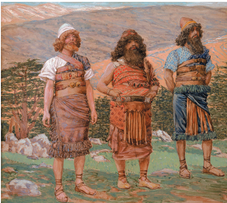
Джеймс Тиссо. Сим, Хам и Иафет. Около 1896 г. Еврейский музей. Нью-Йорк, США