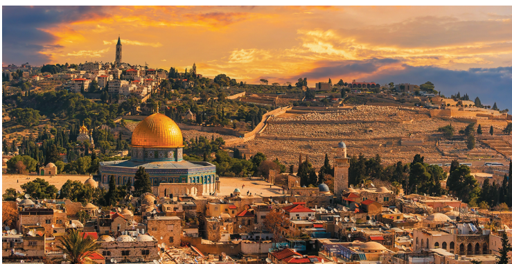
Вид на Храмовую гору Иерусалима