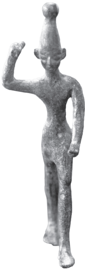
Бронзовая фигурка бога Баала (Ваала). Около XVI–XIII вв. до н. э. Лувр. Париж, Франция

Исследователи отмечают, что мифологический этап прошли все народы. Самые ранние мифы посвящены вопросам космогонии, происхождению природных явлений, возникновению жизни. Характерно, что их образы тесно связаны с окружающей средой: в теплых регионах человек создавался из глины или камня, в северных — из льда или снега.