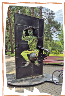
ПАМЯТНИК БАРОНУ МЮНХГАУЗЕНУ

В этом мире все удивительно взаимосвязано. Как известно, реальный барон Карл Фридрих Иероним фон Мюнхгаузен был замечательным рассказчиком, действительно служил в Российской империи и участвовал в Русско-турецкой войне. Интересное совпадение: в 1776 году, когда формировалась и дополнялась, в том числе историей полета на ядре, «Мюнхгаузиада», в Ганновере родилась