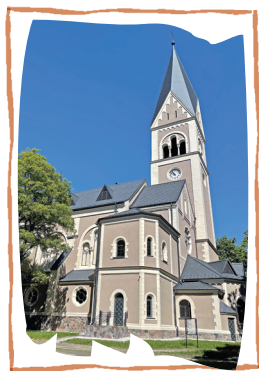
КИРХА ПАМЯТИ КОРОЛЕВЫ ЛУИЗЫ

В 1898 году архитекторы Фридрих Хайтманн и Йозеф Кречманн приобрели эту территорию и стали предлагать клиентам участки для постройки домов и организации территории по неповторимым авторским проектам,