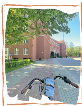
ЗДАНИЕ ПРАВИТЕЛЬСТВА КАЛИНИНГРАДСКОЙ ОБЛАСТИ

Ненадолго остановимся прямо у входа в здание правительства и внимательно рассмотрим еще одну достопримечательность, чудом уцелевшую за эти почти 100 лет. Это массивная