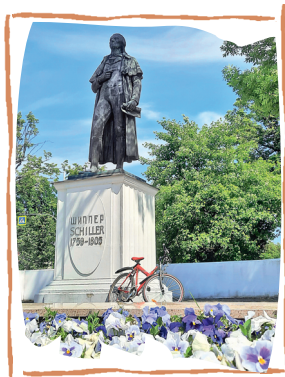
ПАМЯТНИК ФРИДРИХУ ШИЛЛЕРУ

был открыт в Кёнигсберге в 1910 году. Создал его Станислаус Кауэр, талантливый художник и потомственный скульптор. Кауэр руководил кафедрой скульптуры в Академии художеств Кёнигсберга. Известно, что ему позировал грузчик кёнигсбергского порта. Памятник был перенесен на это место в 1936 году и с тех пор является одной из главных достопримечательностей города.