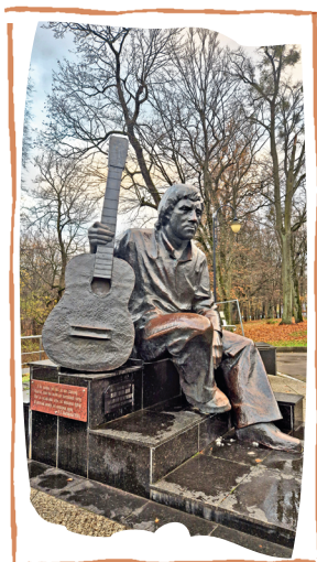
Памятник В. С. Высоцкому