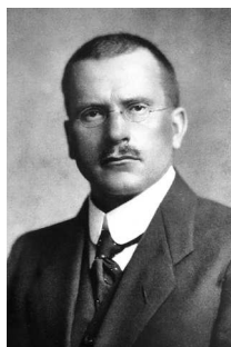
Карл Густав Юнг в молодости

Он не искал легких ответов и не боялся заходить в запретные для науки области, если чувствовал, что именно там скрыт ключ к пониманию человека. Для Юнга психология была не просто методом — она становилась путем к внутренней целостности, интеграции сознательного и бессознательно, обретению смысла личной истории. Он подчеркивал важность индивидуального опыта, символов и мифов, верил, что каждый человек несет в себе нечто большее, чем просто набор реакций и воспоминаний. Юнг оставил после себя не только школу и труды, но и редкий пример того, как наука может обращаться к глубине без утраты разума и к тайне — без страха.