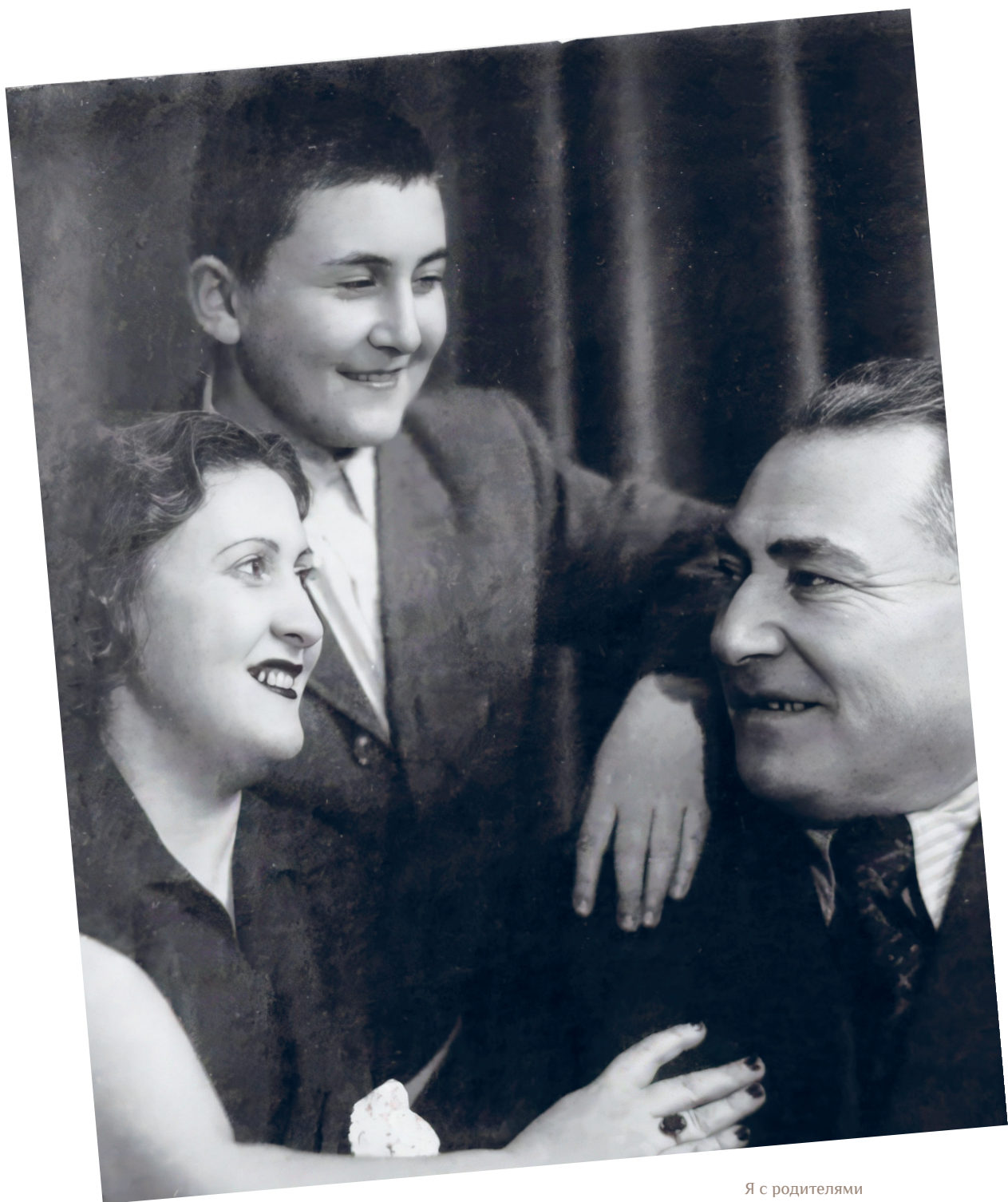
Я с родителями