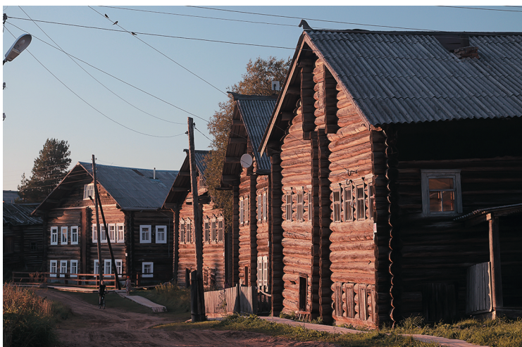
Конек — завершение балки-охлупня, соединяющей скаты крыши, ранее имел ритуальное, обережное значение