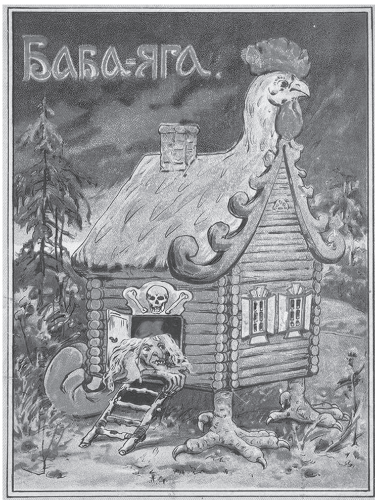
Неизвестный автор. Обложка детской книги с изображением жилища Бабы-яги. Тип. изд-ва И. Д. Сытина. 1915 г.