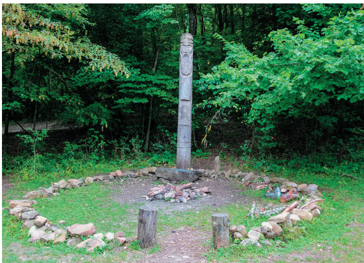
Так могло выглядеть типичное языческое капище