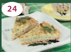
24 Пирог с сыром и творогом