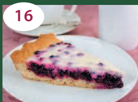
16 Пирог с брусникой