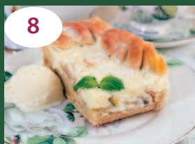
8 Яблочный пирог