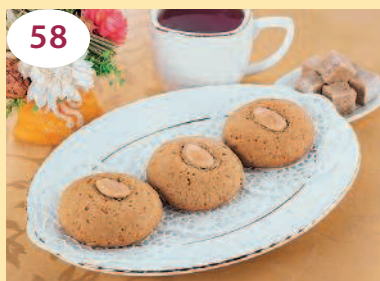
58 Печенье с миндалем, корицей и имбирем