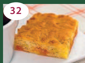
32 Пирог с мармеладом