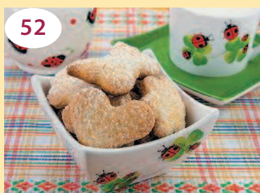
52 Печенье «Сахарное»