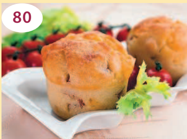
Маффины с сыром и ветчиной