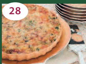
28 Лоранский пирог