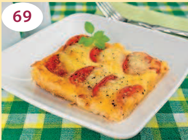
Слоенки с моцареллой