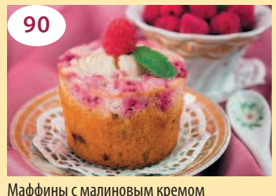
Маффины с малиновым кремом и шоколадом