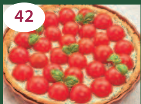
42 Пирог с рикоттой и помидорами