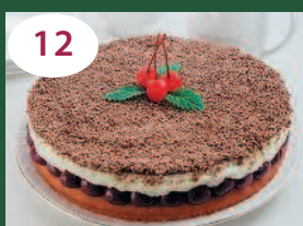
12 Вишневый пирог «Наслаждение»