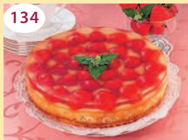
Торт с клубникой, сырным кремом и желе