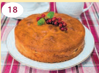
Пирог с абрикосами