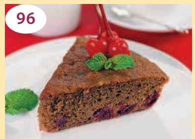
Шоколадный кекс с вишней