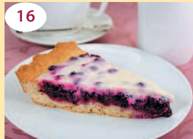
Пирог с брусникой