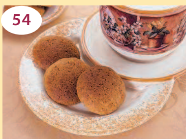
54 Овсяное печенье