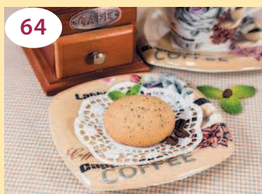
64 Печенье «Кофе с молоком»