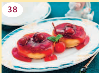
38 Сырники с вишневым соусом