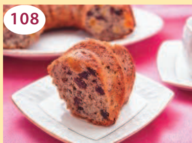
Кекс с курагой, изюмом и орехами