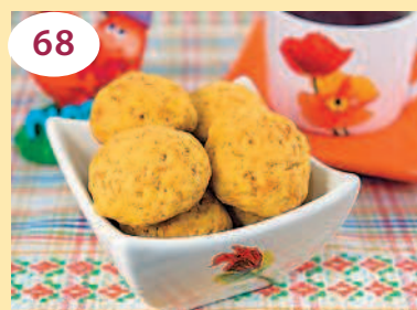
68 Печенье «Морковное»