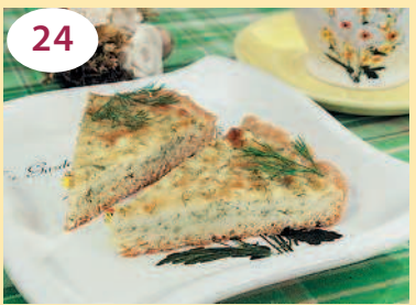
Пирог с сыром и творогом