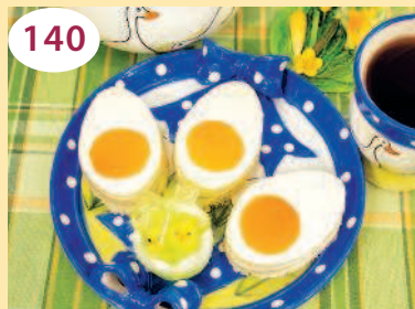
Пирожное «Пасхальное яйцо»