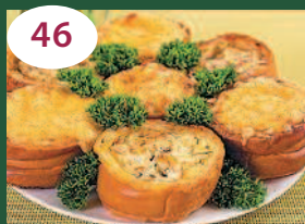
46 «Гнездышки» с рыбой