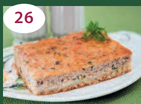
26 Пирог с консервированной рыбой