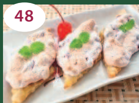
48 Слоенки с брусникой