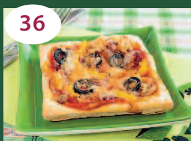
36 Пицца из слоеного теста