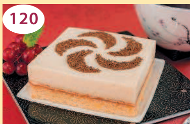
Бисквитное пирожное с апельсиновым суфле