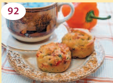
Маффины с беконом и болгарским перцем