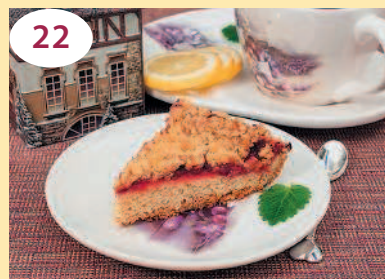
Пирог с брусникой, лимоном и штрейзелем