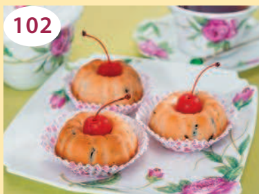
Кексы с ряженкой