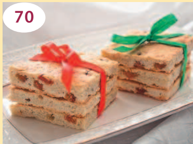
Печенье с изюмом