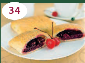
34 Слоеные пирожки с вишней