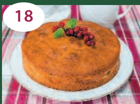
18 Пирог с абрикосами