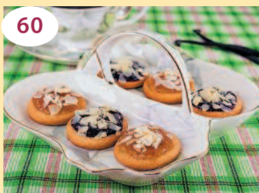
60 Ванильное печенье с джемом и орехами