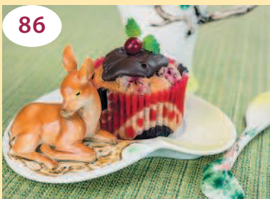
Маффины с ягодой