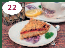
22 Пирог с брусникой, лимоном и штрейзелем