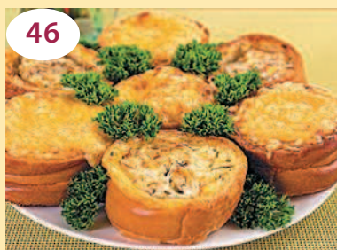
46 «Гнездышки» с рыбой