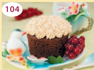
Шоколадные кексы с карамельным кремом