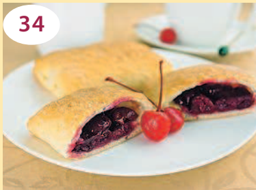
Слоеные пирожки с вишней