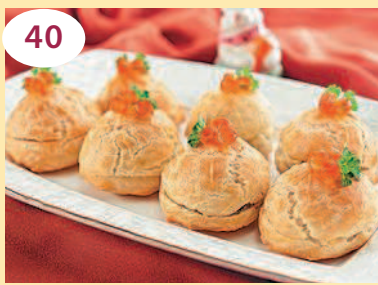
40 Профитролы с тремя вариантами начинки