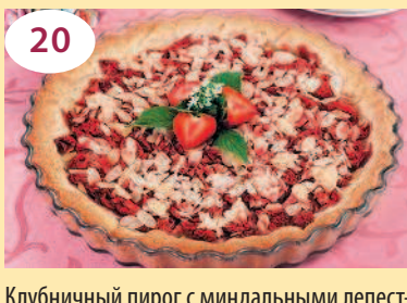
Клубничный пирог с миндальными лепестками или кокосовой стружкой