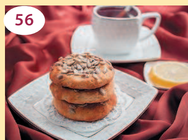
56 Творожное печенье