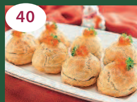
40 Профитроли с тремя вариантами начинки