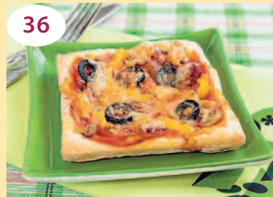
Пицца из слоеного теста