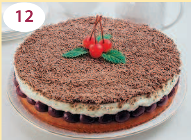
Вишневый пирог «Наслаждение»