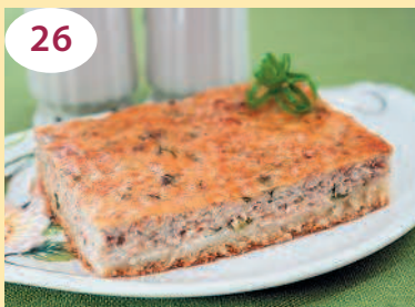
Пирог с консервированной рыбой