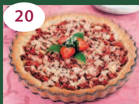
20 Клубничный пирог с миндальными лепестками или кокосовой стружкой