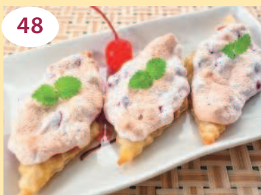
48 Слоенки с брусникой