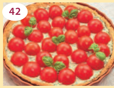
42 Пирог с рикоттой и помидорами