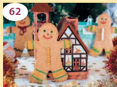
62 Имбирные человечки