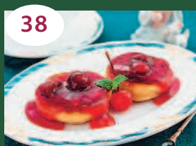
38 Сырники с вишневым соусом