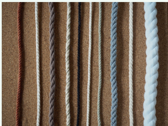
Веревки разного диаметра

час в макраме, — это 3–5 мм. Но можно найти веревку толщиной от 1,5 до 10 мм (и даже больше). Диаметры более 8 мм на производстве называются канатами, у них плотная и тугая крутка, узлы из такого материала плести тяжело или совсем невозможно. Веревка также подходит для создания изделий с бахромой. Из-за кручения она получается слегка волнистой.