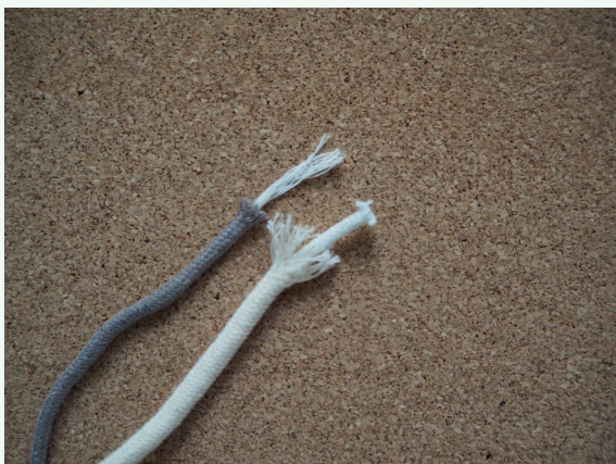
Плетеный шнур с сердечником