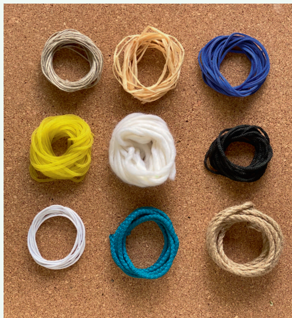
Верхний ряд: лен, рафия, замшевый шнур. Средний ряд: нейлоновый шнур, шерсть, полиэфирный вязаный шнур. Нижний ряд: вошевый шнур, гамаковый шнур, джут

Полиэфирный шнур с сердечником называется гамаковым. Он статичен, то есть совершенно не тянется. По названию можно легко догадаться, что из него плетут гамаки и другие изделия, которые в процессе эксплуатации будут испыты-