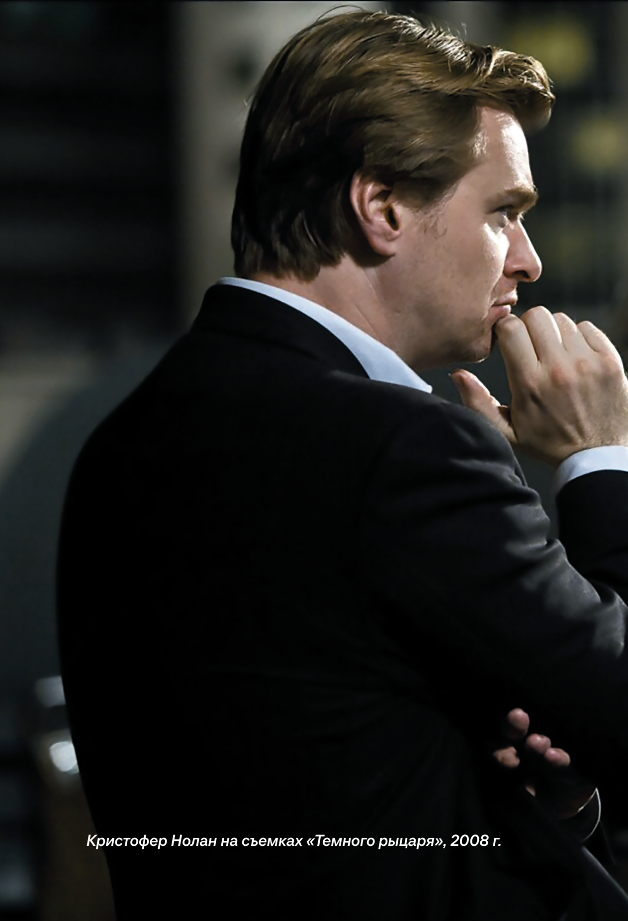
Кристофер Нолан на съемках «Темного рыцаря», 2008 г.