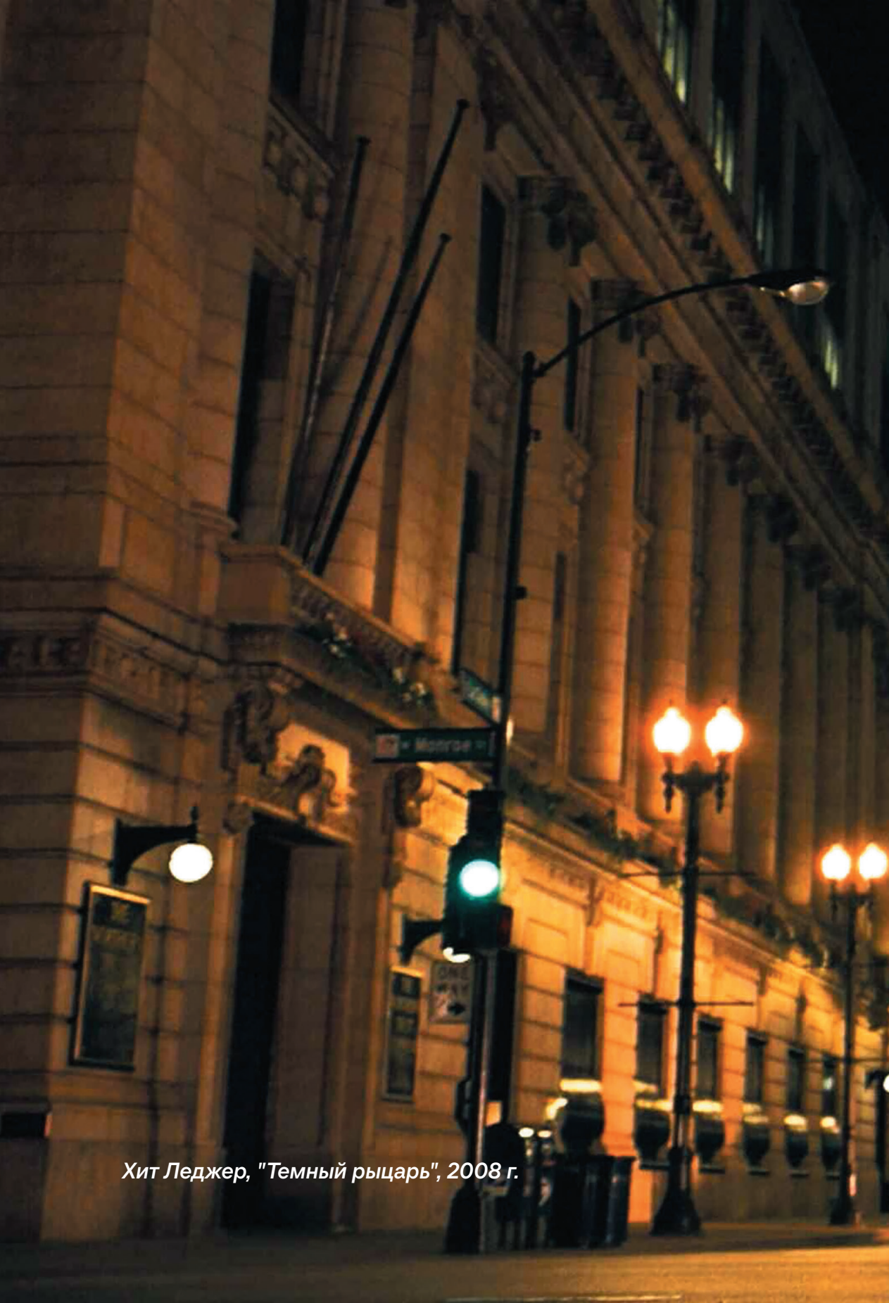
Хит Леджер, "Темный рыцарь", 2008 г.