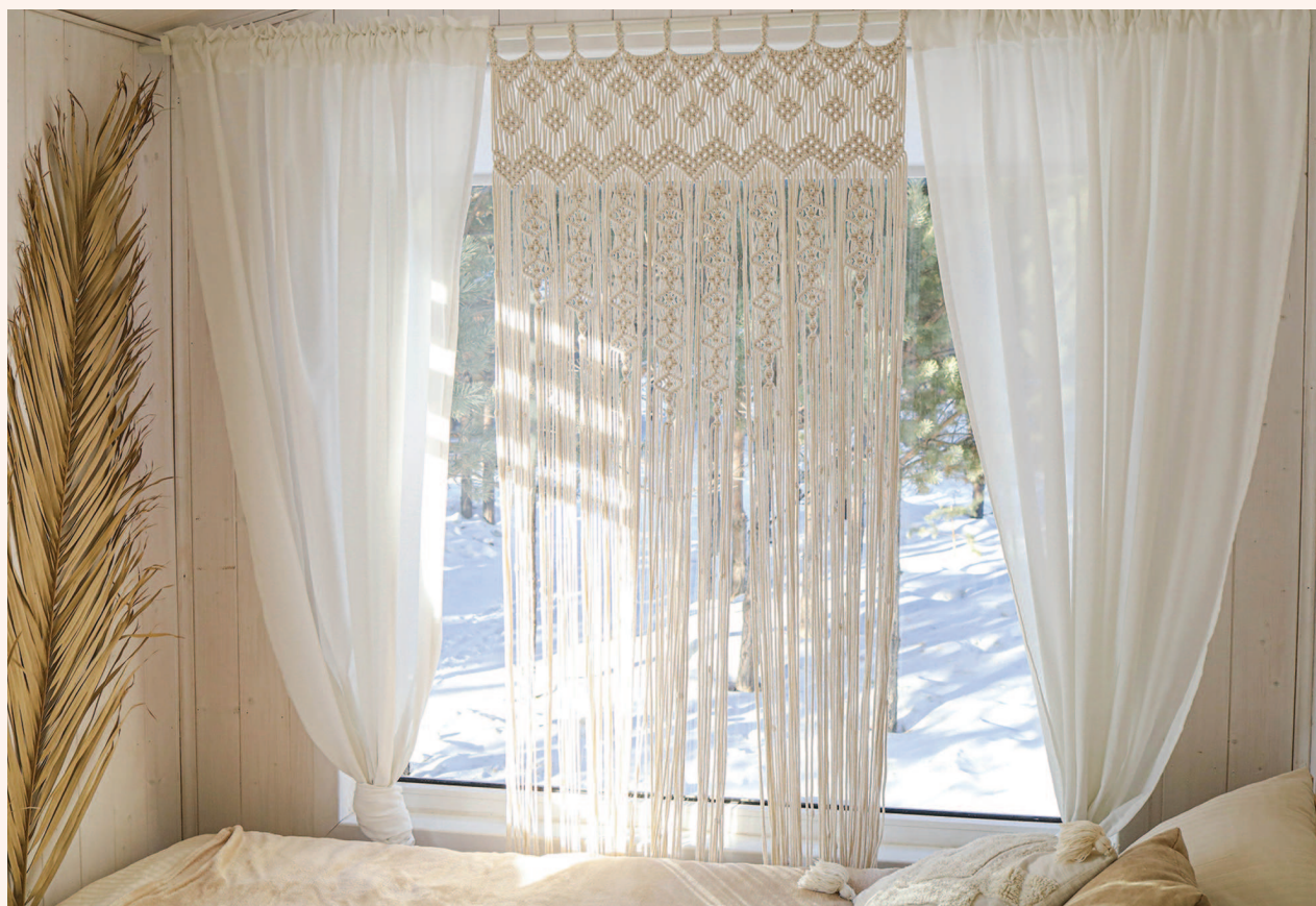
Штора, выполненная на заказ

те по какой теме? Ну конечно, по макраме! Мастер-класс был посвящен плетению панно, что меня крайне удивило, ведь мне казалось, что кружки по плетению остались где-то далеко в школьном прошлом. Я немного углубилась в вопрос и поняла, что макраме переживает очередную волну популярности и сильно изменилось в своем воплощении. Мое желание вспомнить и плести только укрепилось. Примерно месяц у меня ушел на то, чтобы найти подходящий материал, хоть какой-то. Покупала все, что хотя бы отдаленно смахивало на шнуры: тоненькие веревки из строительного, трикотажную пряжу, какие-то странные мотки шнуров из магазинов постоянных распродаж. И, о чудо, наконец нашла прямо в родном Екатеринбурге произ-