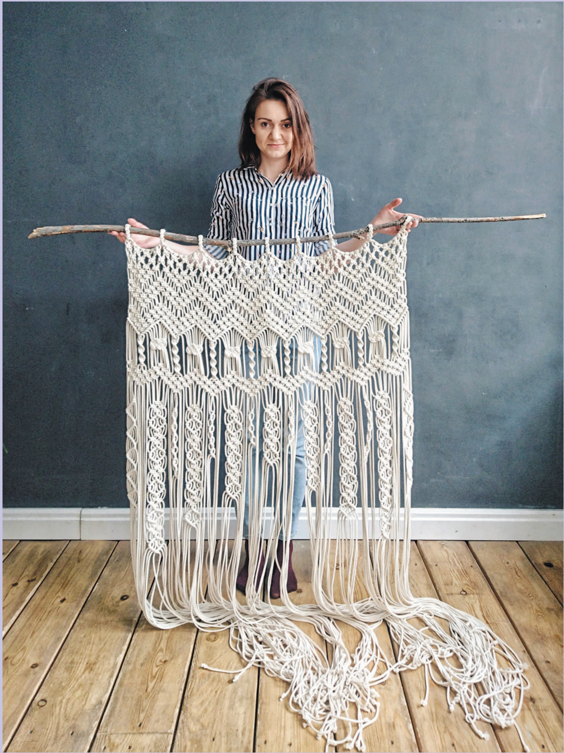
Мое фото с макраме из блога