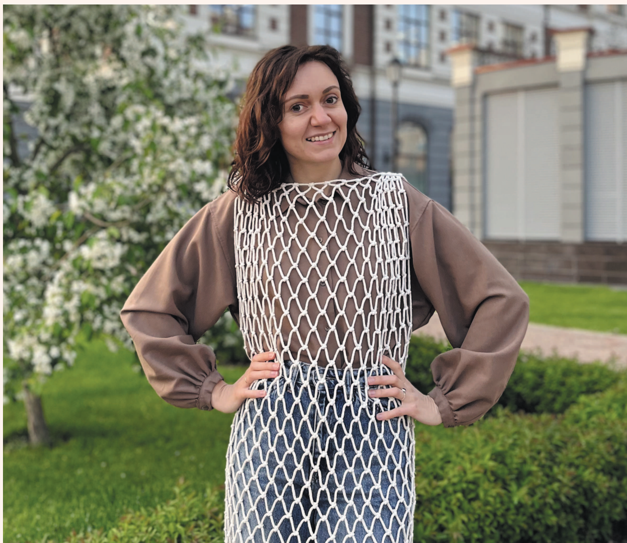
Платье-сетка — хит в мире моды

перь дизайнеры интерьеров активно рисуют в своих визуализациях макраме-панно, абажуры или новые более необычные формы, а текстильная промышленность очень кстати представляет довольно разнообразные варианты материалов для макраме, количество которых увеличивается с каждым годом. В моду вошли экологичность, натуральность, концепция Zero waste (ноль отходов), и поэтому увлечения, связанные с ручной работой, такие как макраме, оказались в тренде.