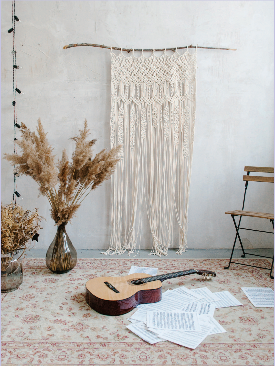
Штора в интерьере фотостудии