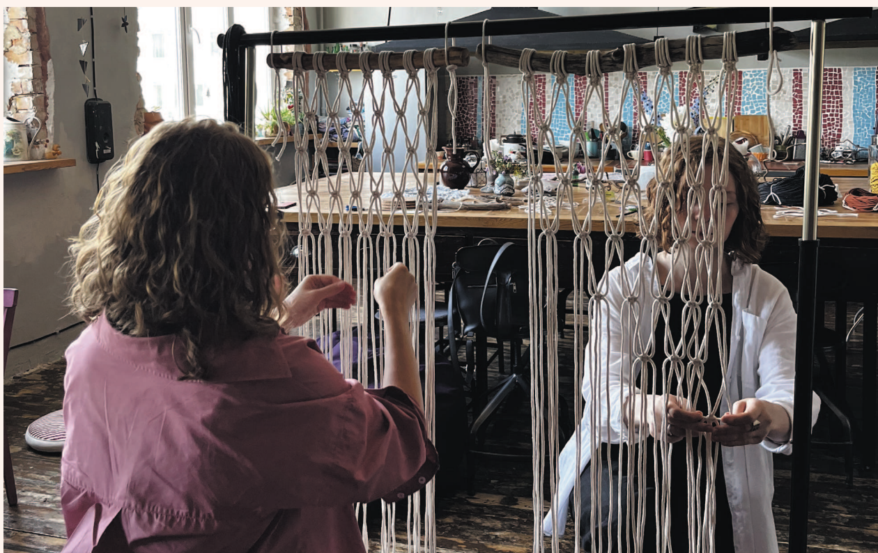
Мастер-класс по плетению мудборда

Если вспомнить такой популярный метод анализа текущего состояния жизни, как «Колесо баланса», то в нем с творчеством связаны сразу несколько секторов: личностный рост, духовность, саморазвитие, отдых и развлечения, хобби (в разных источниках можно встретить различные варианты наи-