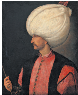
Портрет Сулеймана I Великолепного (Кануни; 1494–1566) – десятый султан Османской империи, и 89-й халиф