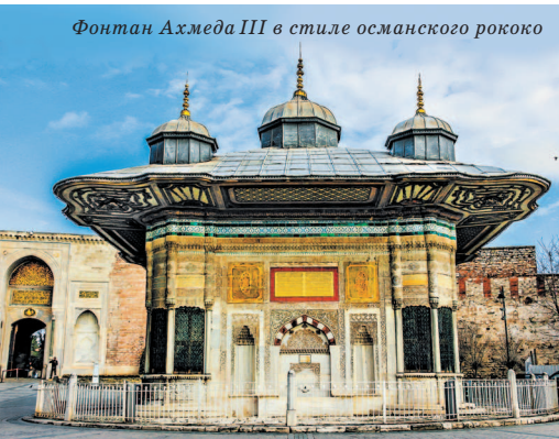
Фонтан Ахмеда III в стиле османского рококо

и большой черный крест, выполненный в технике мозаики на золотистом фоне, и так называемый синтрон (пять рядов сидений, охватывающих апсиду, где во время службы располагалось духовенство). В наши дни помещение церкви используется для проведения концертов.