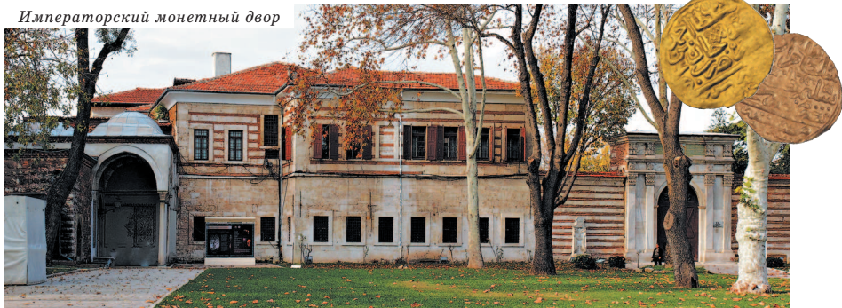
Императорский монетный двор

Нынешнее здание храма Св. Ирины датируется VI в., но ученые выяснили, что ему предшествовало как минимум три строения. Первая христианская базилика была возведена на этом месте на руинах древнего храма Афродиты при римском императоре Константине в IV в. Примечательно, что церковь на протяжении всей своей истории никогда не превращалась в мечеть, поэтому в ней сохранились и атриум (просторное высокое помещение при входе в церковь),