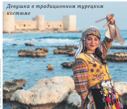
Девушка в традиционном турецком костюме

Турки будут приятно удивлены, если вы употребите всего пару слов на турецком. Например, «Мераба» значит «Здравствуйте». В неформальной обстановке можно использовать «Селям», что переводится как «Привет». Уходя, скажите «Ийи гюнлер», что означает «Всего хорошего». «Спасибо» звучит как «Тешеккюр эдерим», а «Пожалуйста» – «Лютфен».