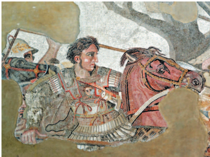
Фрагмент древнеримской мозаики из Помпеи. Александр Македонский (Александр III Великий; 356 г. до н.э. – 323 г. до н.э.) – выдающийся полководец, создатель мировой державы, распавшей после его смерти