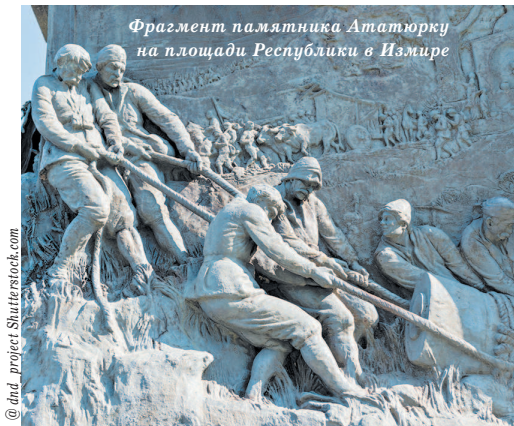
Фрагмент памятника Ата-турку на площади Республики в Измире