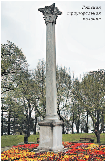
Готская триумфальная колонна