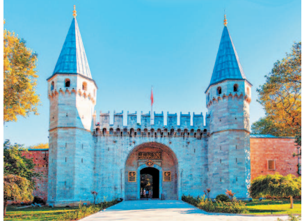
Вход во дворец Топкапы охраняют две башни

Попасть во дворец можно, пройдя через 2 парк Гюльхане. Gulkhāna в переводе с персидского означает «дом роз». Такое название парк получил не случайно: изначально он представлял собой розарий дворца Топкапы. В конце парка высится 3 Готская триумфальная колонна, воздвигнутая еще в III в. в честь победы римских императоров над готами, о чем свидетельствует надпись: «С победой над готами фортуна вновь повернулась к нам». Это древнейший памятник римской архитектуры в городе, дошедший до наших дней. Главная аллея парка ведет на севере к смотровой площадке, откуда открывается великолепный вид на оживленное пространство бухты Золотой Рог, навстречу Босфору. В западной оконечности парка в бывших конюшнях дворца расположился Стамбульский исторический музей исламской науки и техники, открытый в 2008 г. турецким премьер-министром Эрдоганом.