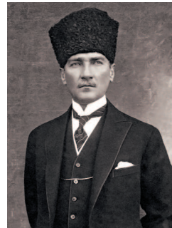
Мустафа Кемаль Ата-турк; Гази Мустафа Кемаль-паша; (1881–1938) – основатель современного турецкого государства

Рим тоже не заставил себя долго ждать. Уже во II в. до н.э. войска Римской республики отправились на завоевания восточных земель. По мере своего продвижения римская цивилизация насаждала свои представления об архитектуре, гигиене, дорогах и праве. Сегодня мы можем наблюдать многие из сохранившихся архитектурных памятников того периода по всей Турции.