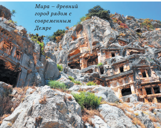
Мира – древний город рядом с современным Демре

Но наибольшее значение для Анатолии имел захват территории турками-османами, правители которых основали здесь ве-