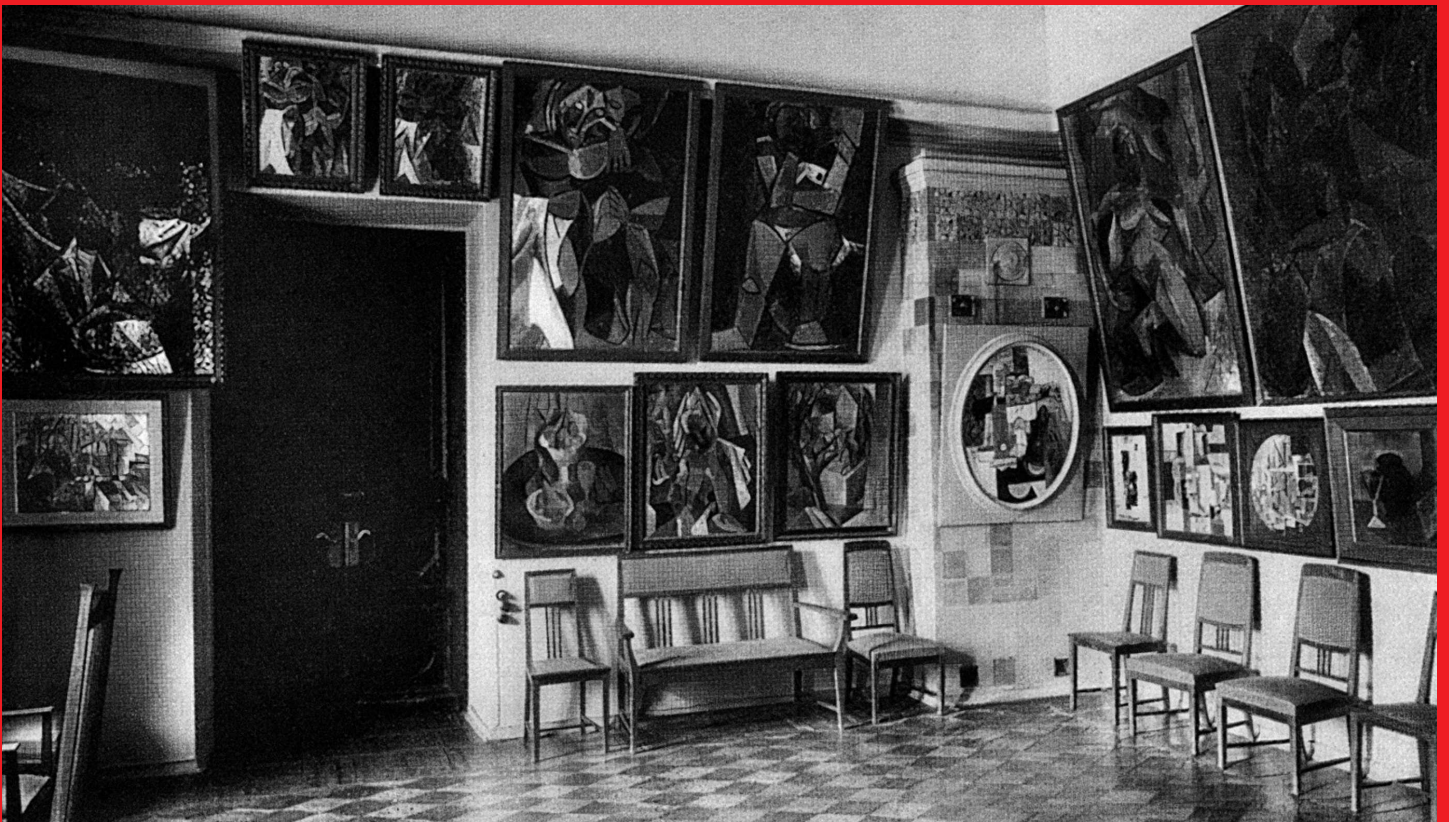
■ Зал Пабло Пикассо в доме Сергея Щукина. Москва. 1913

Русский авангард питался не только национальными истоками и не был изолированным явлением. В панораме европейского модернизма он занимает свое определенное место. Инъекцию современного искусства он получил от Франции. Трудно переоценить влияние французского искусства на ранний русский авангард. Как происходил этот процесс и чем была французская живопись для начинающего русского художника-модерниста? Эволюция французского искусства длиной почти в пятьдесят лет, от «Олимпии» Мане (1863) до «Авиньонских девиц» (1907) Пикассо и «скрипок» Брака (1912–1913), в русском художественном сознании превратилась в своего рода модель «импрессионизм — фовизм — кубизм».