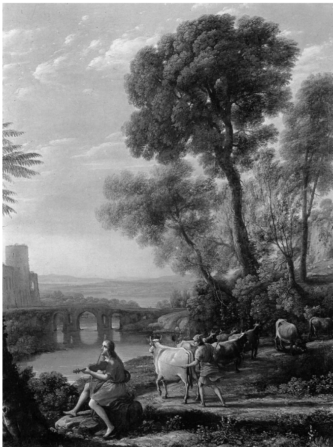
К. Лоррен. Гермес похищает коров Аполлона. Ок. 1645 г.

не разведением скота, а охотой или рыбалкой, ведь на Скандинавском полуострове было не так много мест, подходящих на роль пастбища... И так далее.