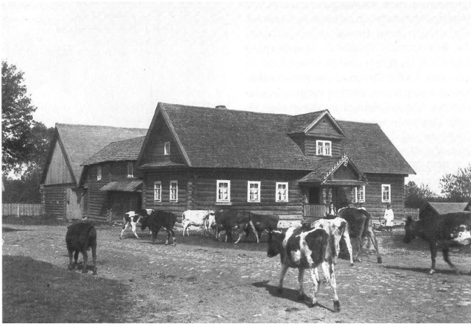
Ингерманландские дома в деревне Вирки (ныне Всеволожский район Ленинградской области). 1911 г.

Что такое миф? Чем он отличается от бывальщины, сказки, легенды? Как рождались сюжеты, которым уже не одна тысяча лет? Давайте начнем путешествие по землям российского северо-запада!