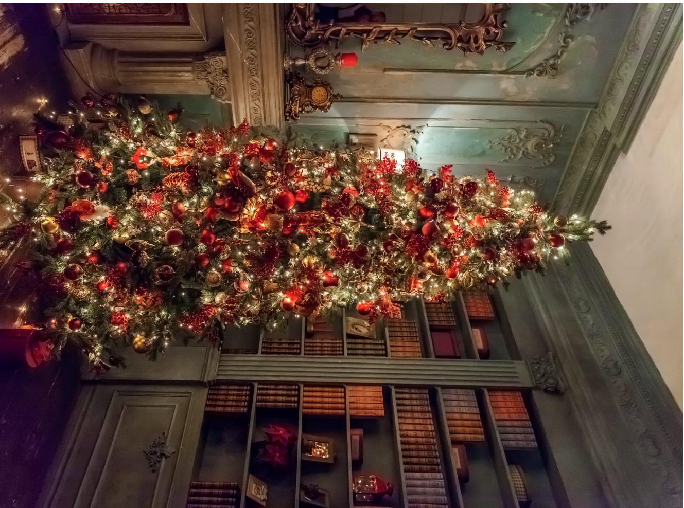
Елка далеко не сразу стала символом всеми любимых зимних праздников