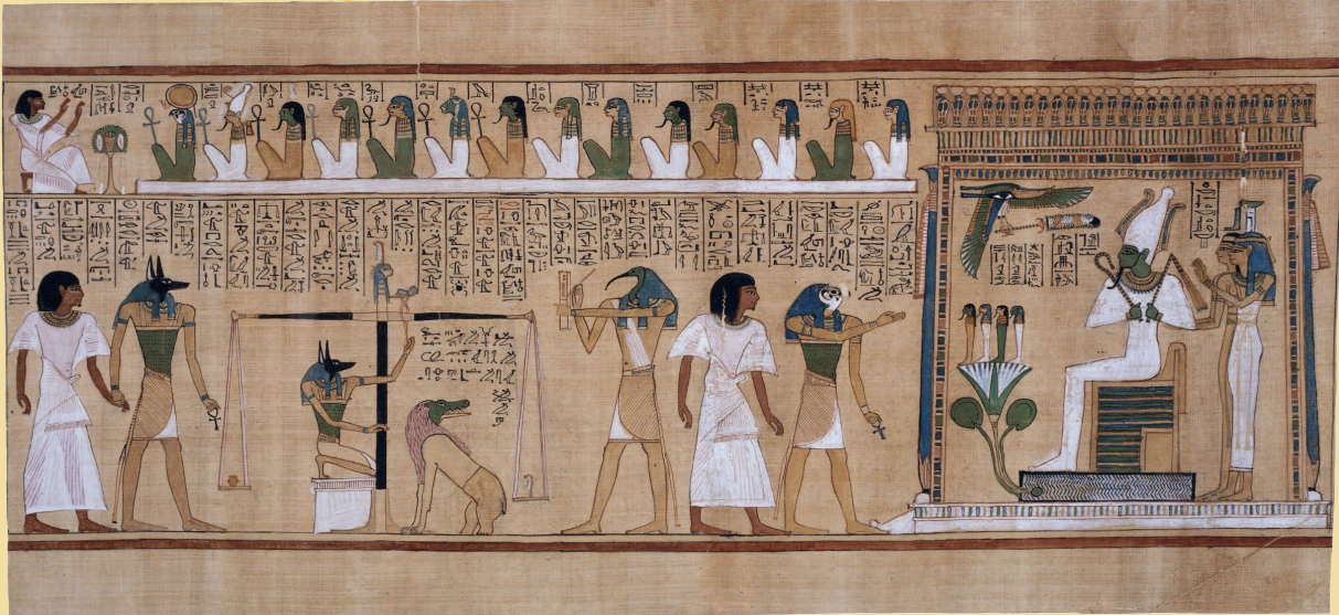
Фрагмент «Книги мертвых» с изображением суда Осириса. XIV в. до н. э.