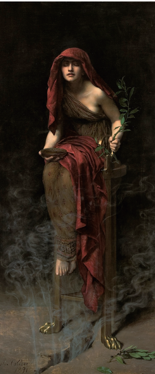
Джон Кольер. Дельфийская жрица. 1891

И все это имеет самое прямое отношение к истории Нового года и Рождества. Потому что корни этих праздников уходят в глубокую древность.