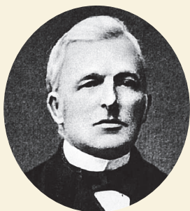
Отец художника — Теодорус Ван Гог. Фото