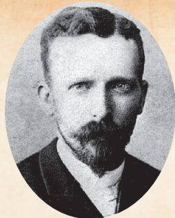
Брат художника — Тео Ван Гог. Фото. 1888

Что об этом думал сам Винсент — никто не знает. Однако известно то, что ему нравилось находиться в одиночестве. Маленький Ван Гог очень любил животных и цветы и коллекционировал все подряд. Часто Винсент один бродил по полям и лугам, по лесам и болотам в окрестностях Зюндерта, собирая насекомых, цветы, птичьи яйца и пустые гнезда. Позже, когда в трудный период своей жизни Винсент находился на юге Франции в психиатрической лечебнице, он по памяти несколько раз воспроизводил на полотнах красивые виды Бранбата. Винсент писал брату Тео, что ему даже снится дом в Зюндерте: он видит во сне каждую комнату и «каждую тропинку, каждое растение в саду, ближайšie окрестности, поля, соседей, кладбище, церковь, наш огород позади нее — все вплоть до сорочьего гнезда на высокой акации, которая росла на кладбище». Он жил в больших городах, в том числе в Париже и Лондоне, но на автопортретах, как считал сам Винсент, он выглядел как крестьянин из Зюндерта: «Я работаю над своими холстами так же, как они