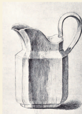
Винсент Ван Гог. Крынка. 1862

В одном из ранних писем, написанном в январе 1873 года, когда Винсент работал в гаагском филиале фирмы «Гупиль и Ко», он писал Тео: «И главное, пиши мне о картинах, которые видишь, — какие они и что в них, по-твоему, прекрасно». Переписка братьев длилась почти восемнадцать лет — с 1872 по 1890 год, а началась, когда Винсенту было девятнадцать лет, а Тео — всего пятнадцать. При этом осталось всего тридцать шесть писем, написанных Тео Винсенту, зато Тео бережно сохранил шестьсот шестьдесят одно письмо, написанное ему