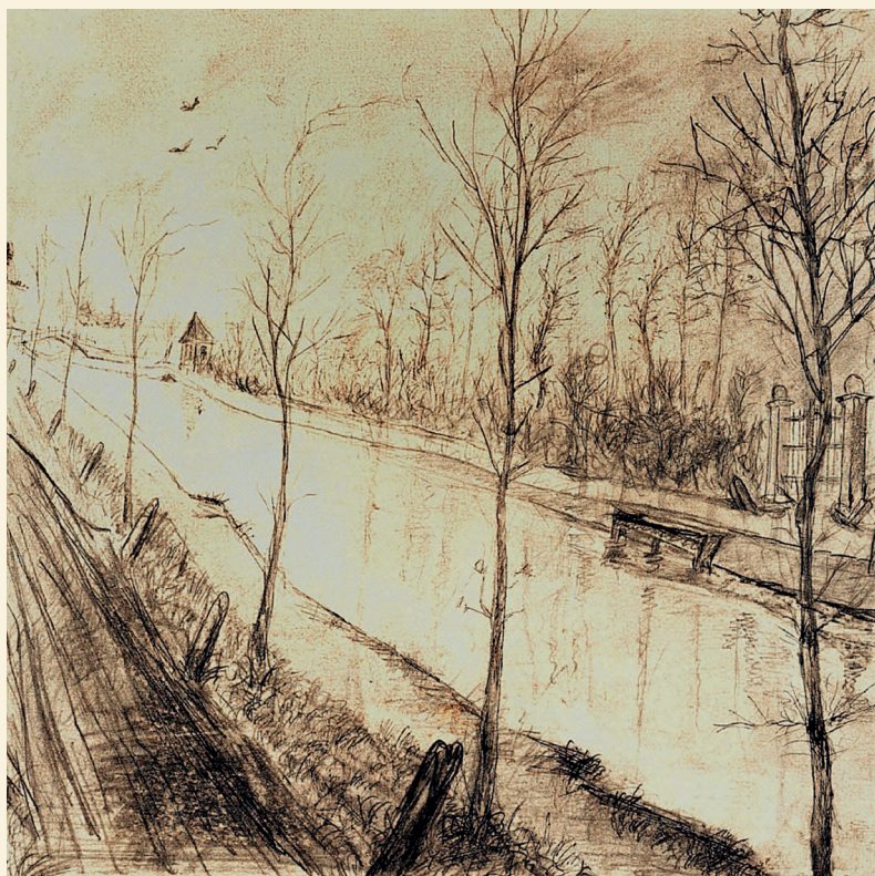
Винсент Ван Гог. Канал. 1872–1873

стал первым и порой единственным почитателем творчества брата, они вместе приобщались к живописи, литературе и, постигая этот мир, делились впечатлениями об искусстве и литературе, в том числе и в длительной переписке.