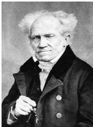
Немецкий философ Артур Шопенгауэр.

Наконец, глава 10 — «За пределами науки: философы все еще в поисках мудрости» — позволит рассмотреть некоторые из философских дискуссий, которые ведутся сегодня в области социологии: от Томаса Куна, утверждающего, что наука развивается в процессе смены парадигм, до теорий о тысячах самых неожиданных способов, благодаря которым слова приобретают свое значение. И в завершение мы ознакомимся с нейрологическими исследованиями, которые проводятся в поисках ответа на вопрос «Как мы думаем?» и приводят нас к воскрешению идеи XVI века, предполагавшей, что человек — не более чем довольно сложно устроенная машина.