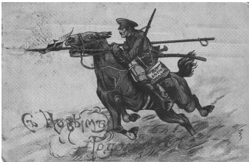
К з к. Открытк 19 век