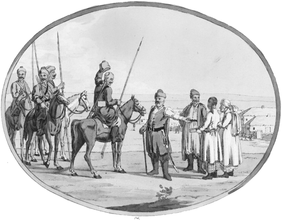
К з ки, гр вюр

турок, поляков, венгров или т т р? Одн ко же вооружение это не было приведено к единому ст нд рту.