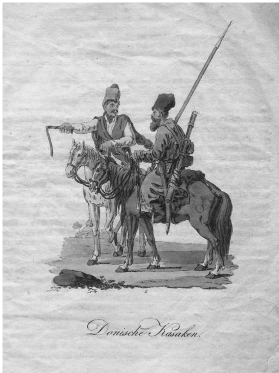
Донские к з ки, гр вюр 18 век

...неприлично к з ку стрелять, он бьет пикою, особливо в крестец.