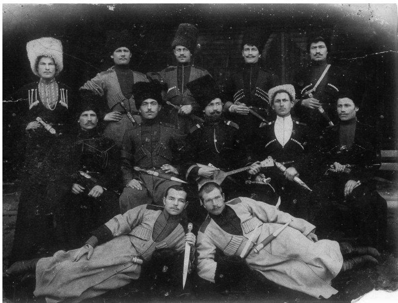
Кубанские казаки, 19 век

Н верное, нам стоило бы в начале книги рассмотреть о том, кто такие казаки и что такое казачество с точки зрения серьезной науки, какими они были в прошлом и что похожи сейчас. Но не писано на эту тему СТОЛЬКО всего, что рухнули бы мы в эти древние дебри с головой и вряд ли бы из них вынырнули. Поэтому впредь от злободневной темы ни слова! А о месте казачества в современном мире лучше всех скажет легендарный товарищ М.И. Платов: