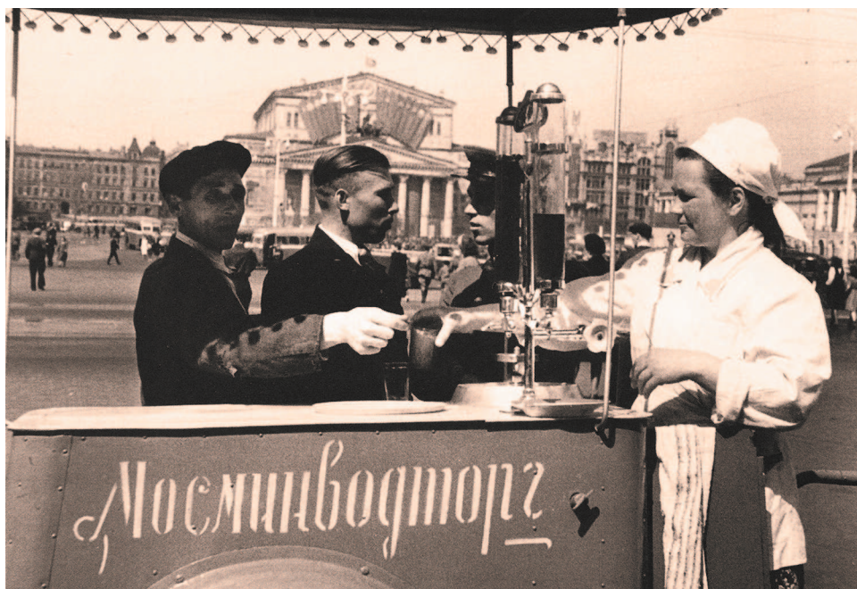
Продажа газированной воды. Москва, 1947 г.

Изобилие автоматов в нашей стране появилось во второй половине 1950-х годов. За рубежом были закуплены торговые автоматы Международного фестиваля молодежи и студентов в 1957 году. Через пару лет, изучив западные образцы и органично их усовершенствовав, в СССР стали производить отечественные торговые автоматы, которые размещались на людных улицах и площадях. Эти автоматы трудились с мая по сентябрь, а в остальное время простаивали под защитой металлических коробов. А уже через несколько лет «механические продавцы» появились и во многих советских кинокомедиях, ненавязчиво рекламируя технически подкованный советский сервис. Исчезли эти автоматы уже после распада СССР, а через несколько лет появились уже другие, более совершенные, но внешне похожие на старые советские автоматы.