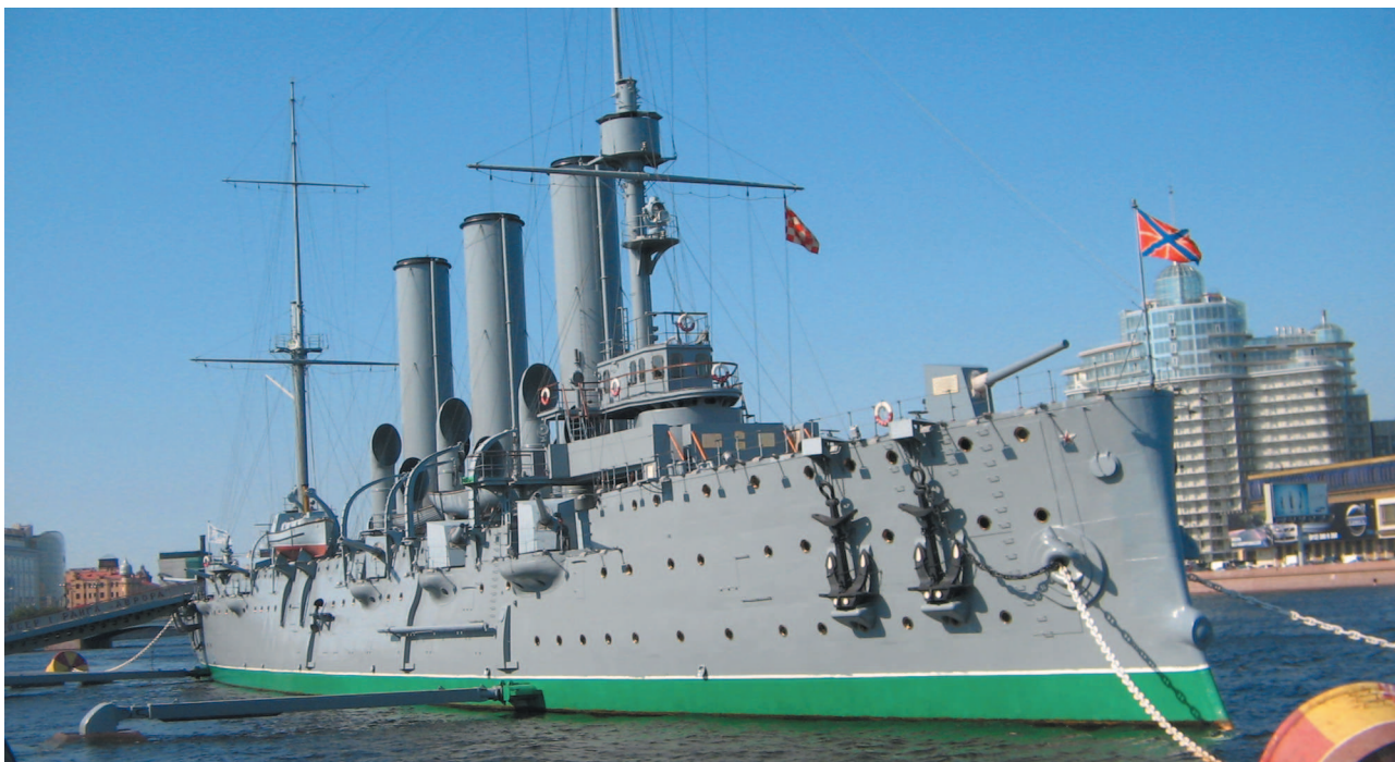
На вечной стоянке в Санкт-Петербурге

В 1965 году на «Ленфильме» был снят художественный фильм «Залп „Авроры“». Для него соорудили из дерева 4-метровую модель крейсера, причем одна из пушек была металлической, чтобы снять момент легендарного выстрела. Трубы маленькой «Авроры» дымили по-настоящему, а каждый иллюминатор подсвечивался миниатюрной лампочкой. Уникальная модель сохранилась до наших дней.