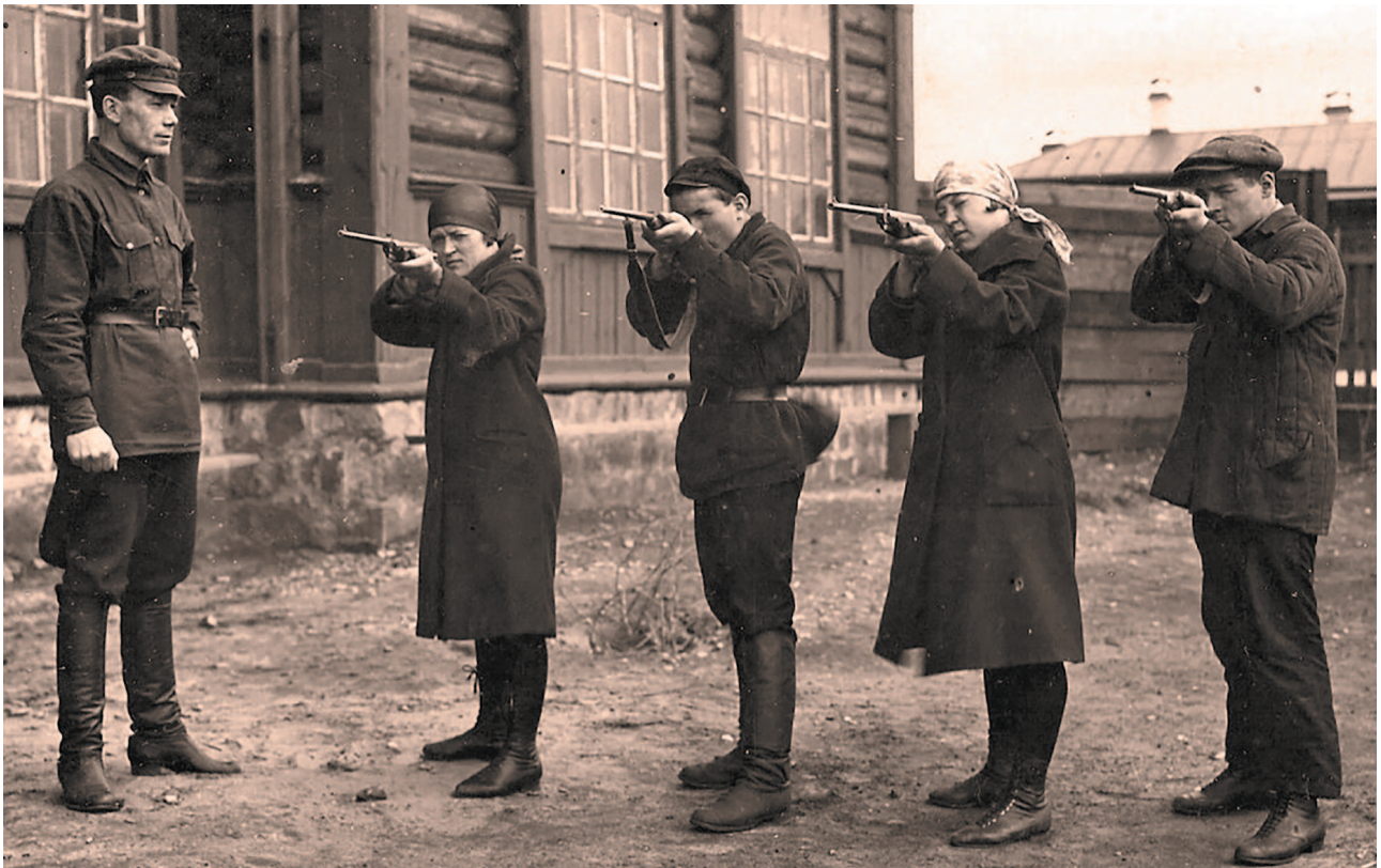
Стрелковая подготовка рабочих одной из фабрик

Свое название – «Ворошиловский стрелок» – значок получил в честь Климента Ворошилова, наркома по военным и морским делам, председателя Реввоенсовета СССР, будущего маршала и верного соратника Сталина.