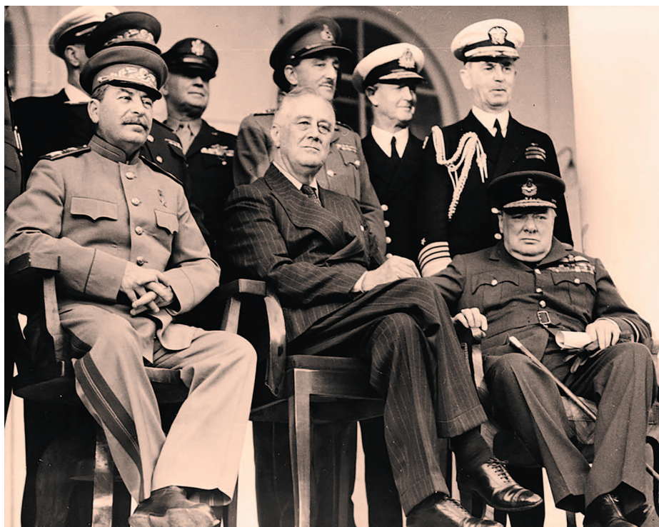
Фото «большой тройки» в Тегеране

А сразу после окончания церемонии вручения меча вожди «большой тройки» отправились фотографироваться на террасу, куда были принесены три кресла. Так была сделана историческая фотография Тегеранской конференции, обошедшая весь мир.