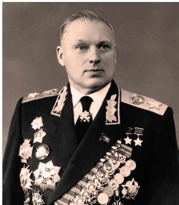
Маршал Советского Союза К. К. Рокоссовский с орденом Победы

Но и в этот раз вождь не обошелся без внесения правок: надлежало увеличить в размерах вписанное в круг в центре ордена изображение Спасской башни и части Кремлевской стены, наложив их на голубой эмалевый фон, а также уменьшить штралы (чеканные лучики) между концами пятиконечной звезды, составлявшей