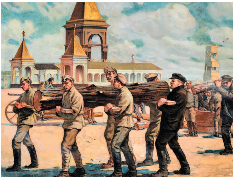
Советский агитационный плакат «Ленин на субботнике», художник Соколов М., СССР, 1929 г.

Правда, судя по мемуарам, бревно вместе с Лениным в тот день несли примерно 800 человек... Даже с учетом того, что работа шла несколько часов и бревно было не единственное, цифра впечатляет.