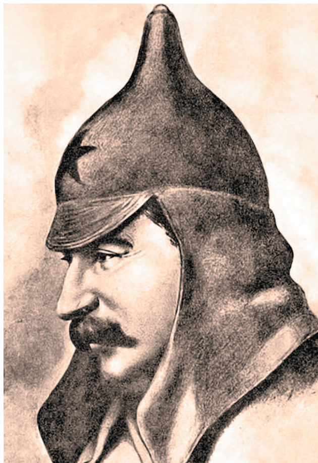
Иосиф Сталин в буденовке

Первым подразделением, организованно получившим новые головные уборы, стал отряд, сформированный из рабочих Иваново-Вознесенска и отправленный под командование Фрунзе на Восточный фронт. Отсюда и «фрунзенка». Бытовали и другие народные названия: «здравствуй и прощай» для летней полотняной буденовки, введенной в 1922 году, «громоотвод», «умоотвод». Известна рискованная шутка сере-