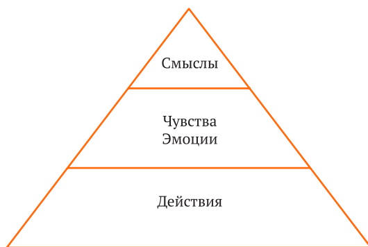
Пирамида трех уровней

Сейчас самое время взять ручку, бумагу и нарисовать треугольник. Готовы? Рисуем пирамиду с широким основанием. Изобразите, как вам нравится, и поделите ее по горизонтали на три части. Получится пирамида из трех слоев. Возможно, сейчас у кого-то придут ассоциации с пирамидой потребностей Маслоу 1 . Визуально пирамиды похожи, но смысл этой фигуры — в другом.