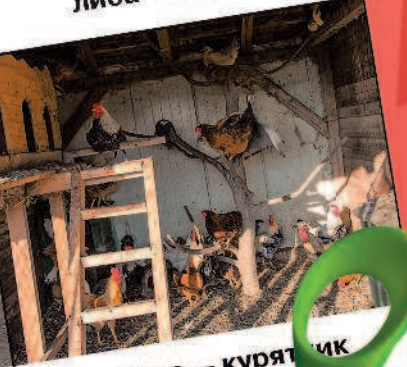
курица — курятник