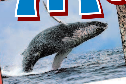
кит — океан