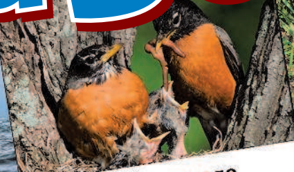
птица — гнездо