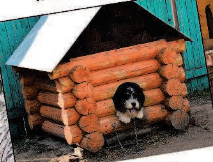
собака — конура