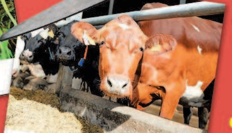
корова — коровник