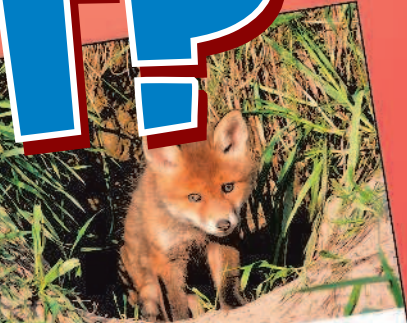
лиса — нора