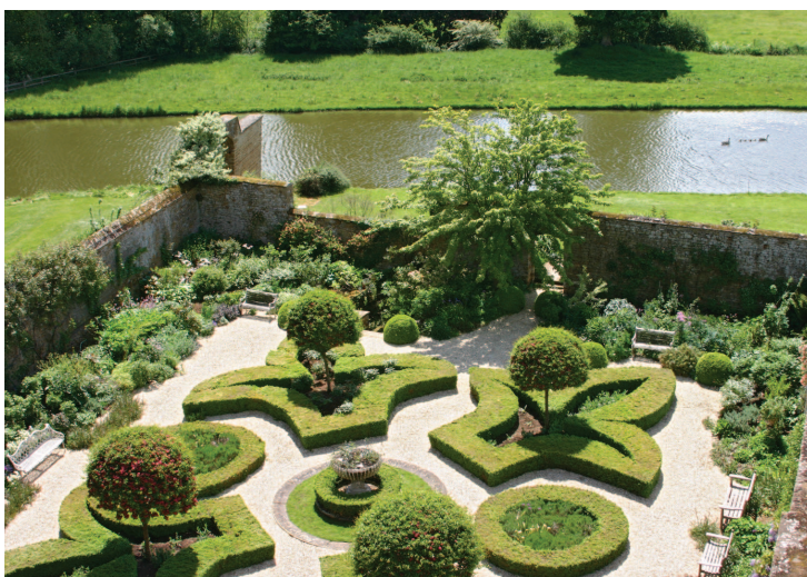
Закрытый сад с формальной планировкой

Совсем не обязательно заказывать проект в ландшафтной мастерской, хотя при удачном стечении обстоятельств это существенно облегчает решение проблем, связанных с дизайном сада, и позволяет создать сад качественно иного уровня.