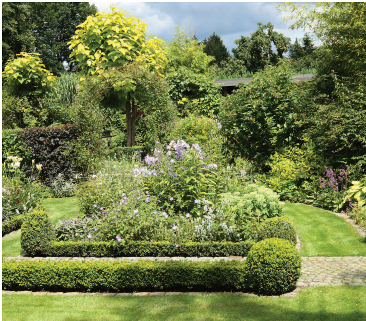
Изгороди из стриженных растений всегда эффектно смотрятся, но требуют немало ухода

внимательно приглядится к планировке приусадебных участков в загородных поселках и садовых товариществах не только центральных, но и многих других областей России. Однако нередко по прошествии некоторого времени обозначенный подход к обустройству участка оборачивается частичной или полной переделкой придомовой территории.