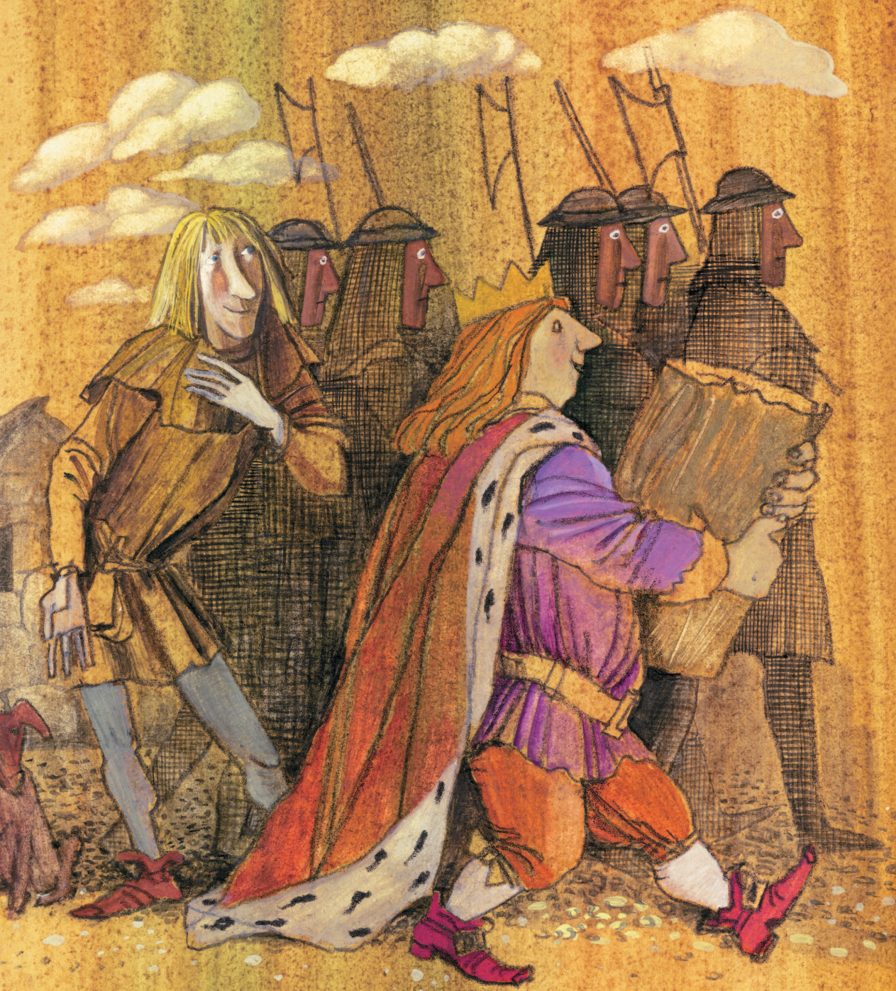
Рисунки О. Филипенко