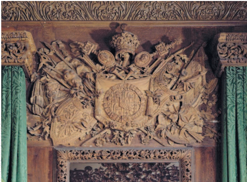
Герб 6-го герцога Сомерсета, вырезанный из липы Гринлингом Гиббонсом (1648—1721). Резьба была частью орнамента на Петорут-хаус в Сассексе, Соединенное Королевство

В XVIII веке миграция выросла с нескольких сотен до миллионов переселенцев, и в Северную Америку переехали некоторые из лучших резчиков по дереву из Европы и Скандинавских стран. Этот приток талантов