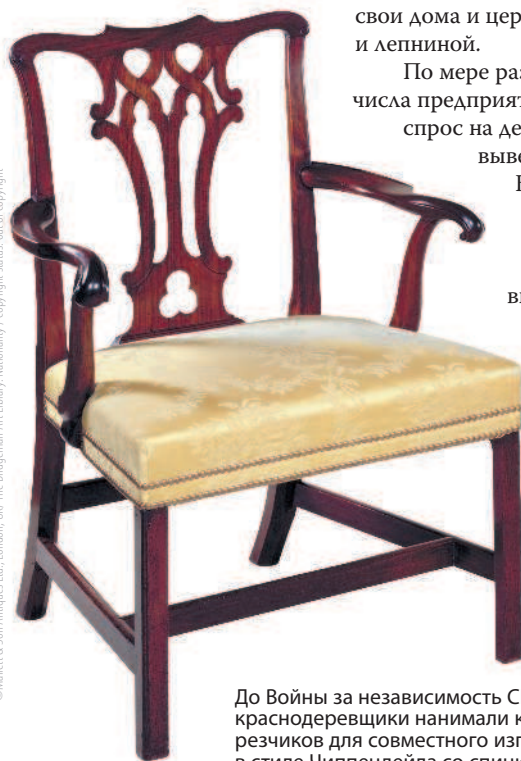
©Mallet & Son Antiques Ltd., London, UK/The Bridgeman Art Library, Nationality / copyright status: out of copyright

До Войны за независимость США многие краснодеревщики нанимали квалифицированных резчиков для совместного изготовления мебели в стиле Чиппендейла со спинками с переплетенными элементами и прямоугольными ножками со сглаженными гранями. Кресло принадлежит Mallet & Son Antiques Ltd, Лондон, Соединенное Королевство.