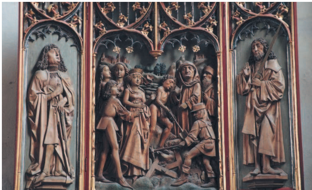
©Maia Himmelant, Wolframs-Eschenbach, Bayern, Germany/ Bildarchiv Stefens/The Bridgeman Art Library Nationality / copyright status: Public / out of copyright

оказал огромное влияние на Американский континент, где иммигранты украшали свои дома и церкви резьбой по дереву и лепниной.