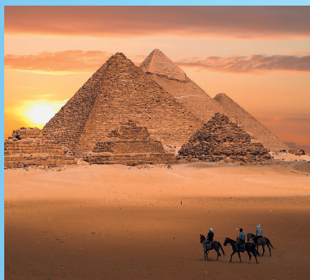
Знаменитые пирамиды в Гизе (Египет)

Африка является колыбелью человечества со многими памятниками культуры. Именно поэтому тысячи людей срываются с насиженных мест и едут сюда, чтобы прикоснуться к древнейшей культуре, своими глазами увидеть пирамиды, дикинвинные затерянные города и храмы. Бесконечное восхищение чудесами Африкой не пройдет никогда.