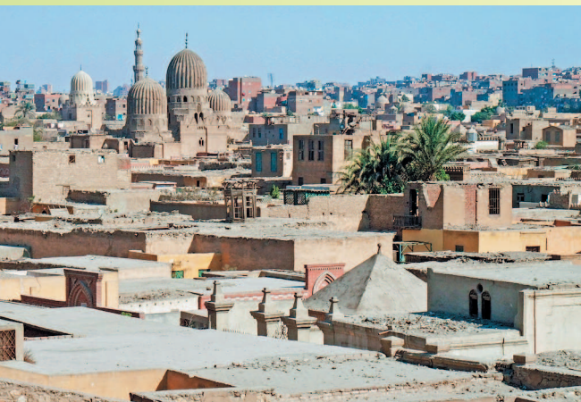
Город мертвых, Имам аль-Шафей — обширное и самое старое кладбище в Каире