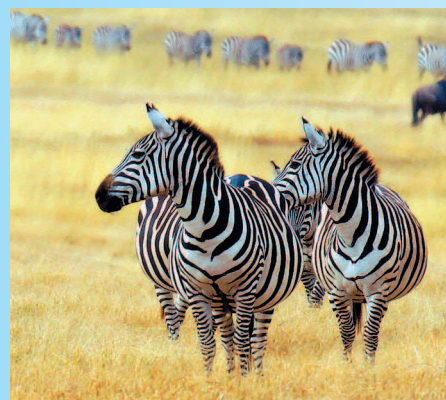
Зебры в парке Серенгети

В Африке расположены уникальные природные зоны с красивой и дикой природой. На севере это пустыня Сахара, а на востоке и юге африканского континента — многочисленные заповедники и национальные парки, внесенные в Список Всемирного культурного и природного наследия человечества и призванные сохранить уникальный животный и растительный мир континента.