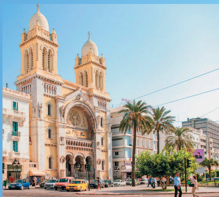
Собор Сент-Винсент де Поль в столице Туниса

Попытаться найти некий универсальный образ африканских городов — задача бесполезная, так как страны на этом континенте слишком разнообразны и многолики. В регионе Сахары облик городов с их мечетями, минаретами и европейскими кварталами оживляет влияние арабской и колониальной культур. Напротив, на юге Африки доминируют современные очертания и четкие контуры горизонта.