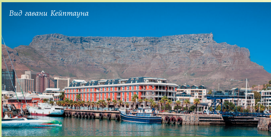
Вид гавани Кейптауна

Каждый год с октября по март город заполняют туристы, приезжающие понежиться под теплым летним солнцем южного полушария. Помимо неперменного подъема на фуникулере на Столовую гору (высота 1087 м), гостям можно порекомендовать совершить экскурсию в прибрежный район Виктория и Альберт. Здесь находятся недавно отреставрированные гавань и причалы, а также два исторических дока в заливе Тейбл-Бей, а на прилегающих улочках расположились всевозможные сувенирные лавки, музеи, отели и рестораны. Неподалеку находится гавань для яхт, «Аквариум двух океанов» и театр под открытым небом.