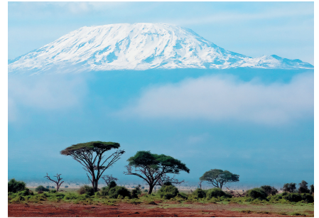
Гора Килиманджаро (Танзания)

Эта прекрасная, заслуживающая внимания книга раскрывает перед путешественниками душу самых разных мест мира.