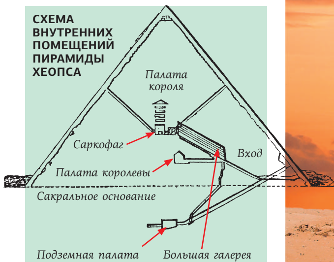
СХЕМА ВНУТРЕННИХ ПОМЕЩЕНИЙ ПИРАМИДЫ ХЕОПСА

Единственное из семи чудес света, дошедшее до наших дней, — это пирамида Хеопса. Но и другие памятники Древнего Египта уже много веков поражают воображение людей.