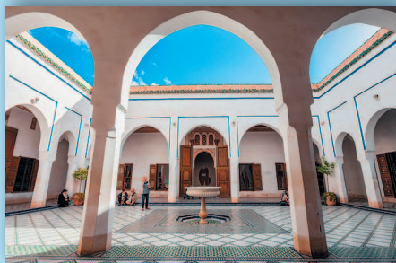
Дворец Бахия в Марракеше